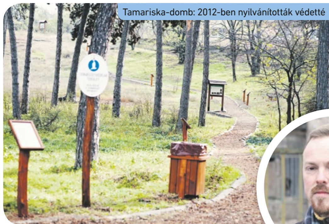
Tamariska-domb: 2012-ben nyilvánították védetté

Az ellenzéki pártok országgyűlési választások során eddig talpon maradt po-