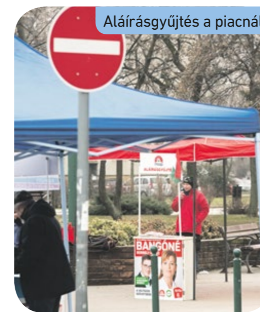
Aláírásgyűjtés a piacnál

A Kabán lakó politikus asszony Püspökladányban indult az országgyűlési választásokon 2010-ben, 2011-ben egy