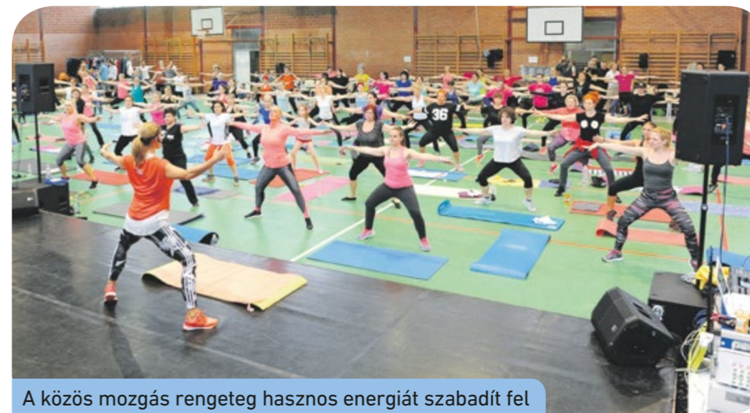
A közös mozgás rengeteg hasznos energiát szabadít fel

Óriási érdeklődés mellett zajlott az első csepeli fitnessnap március 24-én. A program sikerét mutatja, hogy az ÁMK tornacsarnoka teljesen megtelt sportolni vágyókkal.