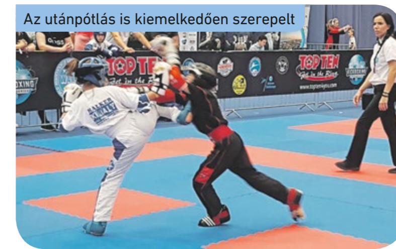
Az utánpótlás is kiemelkedően szerepelt