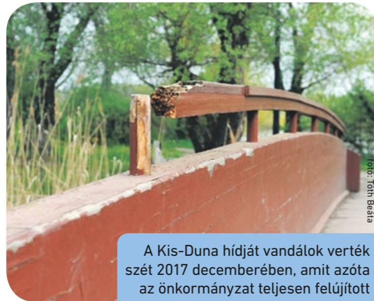
A Kis-Duna hídját vandálok verték szét 2017 decemberében, amit azóta az önkormányzat teljesen felújított

letti szökőkutat pedig szintén aznap reggelre rongálták meg. Ott a szökőkút szórófejét verték addig kőlapokkal, amíg teljesen el nem ferdült és használhatatlanná nem vált. Utóbbi esetben