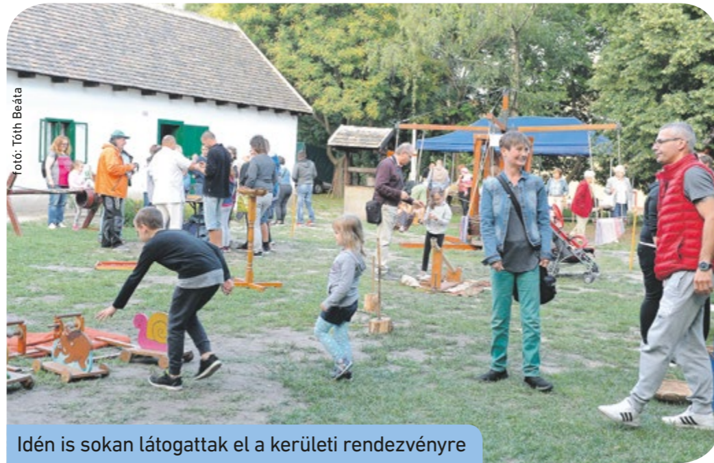
Idén is sokan látogattak el a kerületi rendezvényre

Népszerű volt a Csepel és a gyár története című állandó kiállítás, de az 1838-as