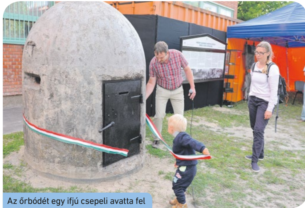
Az őrbódét egy ifjú csepeli avatta fel