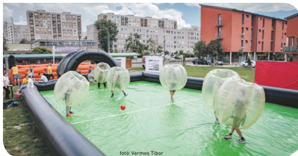
fotó: Vermes Tibor

Most minden a focivébéről és a testmozgásról szól: ennek jegyében rendeztek sportnapot a Mozdulj Gamer Mozgalom szervezői a Csepeli Szurkolói Arénában, június 24-én. Miközben az óriáskivetítőn a világbajnokság éppen esedékes mérkőzéseit figyelték a nézők, mások különféle ügyességi vagy szórakoztató programokon vehettek részt. A különleges események főleg a gyerekeket és a fiatalokat vontatták, akiknek minden ingyenes volt.