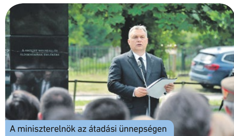
A miniszterelnök az átadási ünnepségen