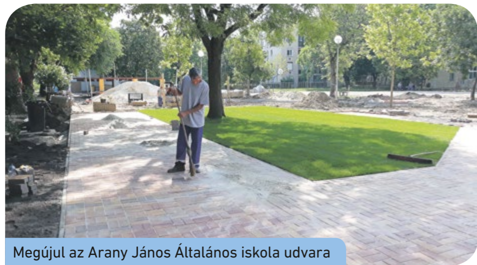
Megújul az Arany János Általános iskola udvara

mének befejezését – ami energetikai beruházás – október közepére ígéri a beruházás előkészítését és annak lebonyolítását végző Csepeli Városfejlesztési Nonprofit Kft. Zajlanak a munkálatok az Arany János Általános Iskolánál is. Az intézmény udvarán tereprendezést végeztek, öntözőrendszert építettek, elkezdték a kert szegélyének megépítését, villanyoszlopokat betonoztak és megkezdődött a térkövezés. A Kölcsey iskolánál található KRESZ-pálya felújítása pedig hamarosan a végére ér.