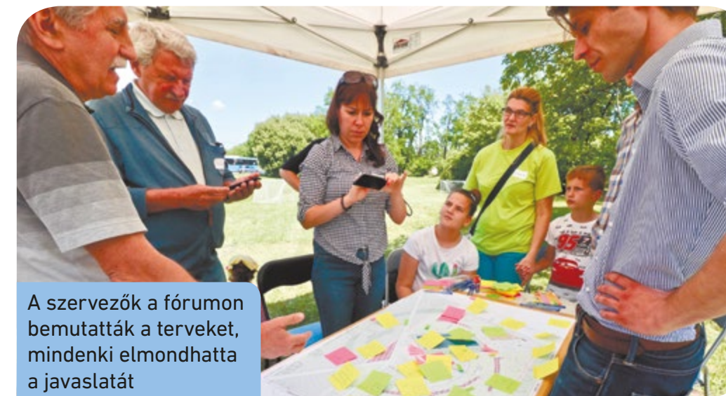
A szervezők a fórumon bemutatták a terveket, mindenki elmondhatta a javaslatát

Tervegyeztető lakossági fórumra várták június 1-jén a Tejút utca melletti park környékének lakóit. A Főkert Zrt. szabadidős zöldfelület terveit készítette el erre a területre, erről mondhatták el véleményüket a környékbeliek. Az egész napos rendezvényre a tervezett beruházás helyszínén, a Rákóczi u. – Tejút u. – Rakéta u. által határolt parkban került sor.