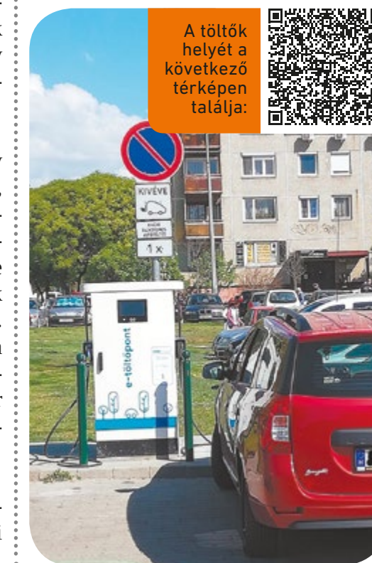
A töltők helyét a következő térképen találja:

DC villámtöltők: 1211 II. Rákóczi F. út 189–191. (Csepel Plaza, parkoló); 1212 Kossuth L. u. 108. (Csepeli Piac)