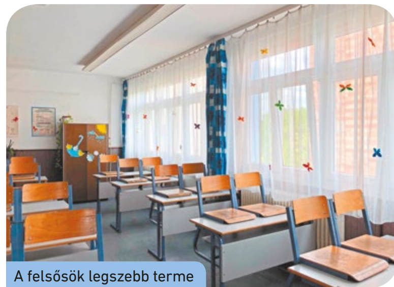
A felsősök legszebb terme

1212 Budapest, Bajcsy-Zsilinszky u. 59/A Tel.: +36-1/795-8211 delpest@kk.gov.hu www.kk.gov.hu/delpest