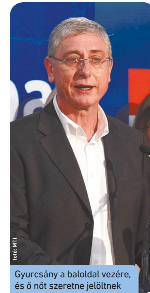
Gyurcsány a baloldal vezére, és ő nőt szeretne jelöltnek

A kerületi megállapodások újratárgyalása körül ugyanakkor nagy lett a csend. Ez azt sejteti, hogy ide helyeződik át a csetepaté, ha végre döntés születik a közös ellenzéki főpolgármester-jelöltreől.