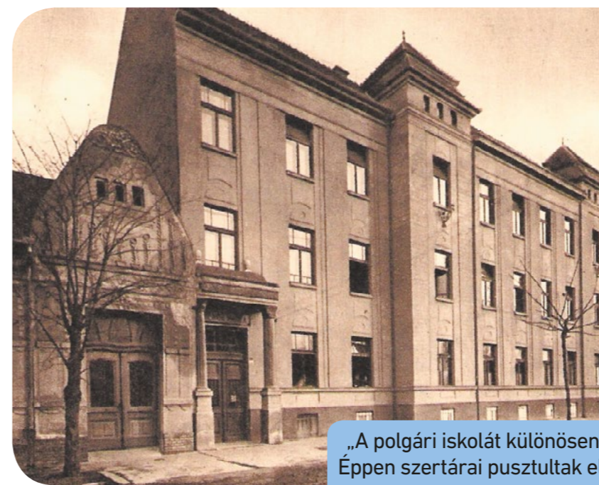
„A polgári iskolát különösen súlyosan érintette a telitalálat. Éppen szertárai pusztultak el tökéletesen.” (Csepeli Őrszem)