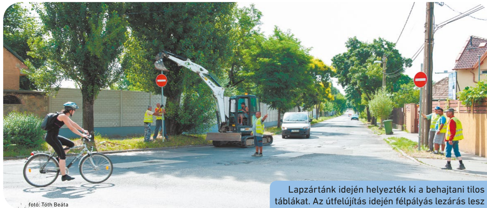
Lapzártánk idején helyezték ki a behajtani tilos táblákat. Az útfelújítás idején félpályás lezárás lesz