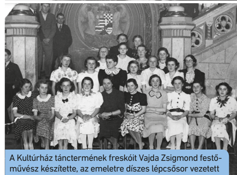
A Kulturház tánctermeinek freskóit Vajda Zsigmond festőművész készítette, az emeletre díszes lépcsősor vezetett

„Az angolszász terrorbombázók fekete szerdája Csepelen” – ez volt a főcíme a Csepeli Őrszem című hetilap 1944. június 16-án megjelenő számának. Az újság mindenképp előtt a 14-ei légitámadásokról tudósított, ahogy – többek között – írja: „A Kulturház, a polgári iskola, a plébánia együtt pusztultak a többi családi házzal együtt.”