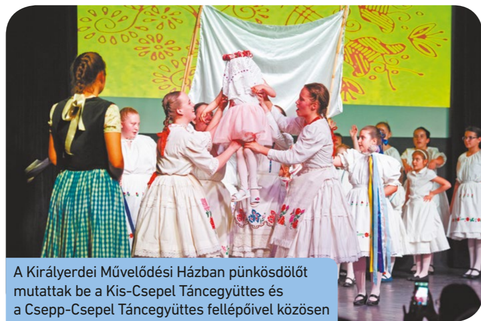
A Királyerdei Művelődési Házban pünkösddőlőt mutattak be a Kis-Csepel Táncgyűttes és a Csepp-Csepel Táncgyűttes fellépőivel közösen

A társastánc- és a néptáncgálán komplett színpadi koreográfiát adtak elő a diákok.