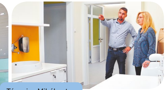
Tánics Mihály utca