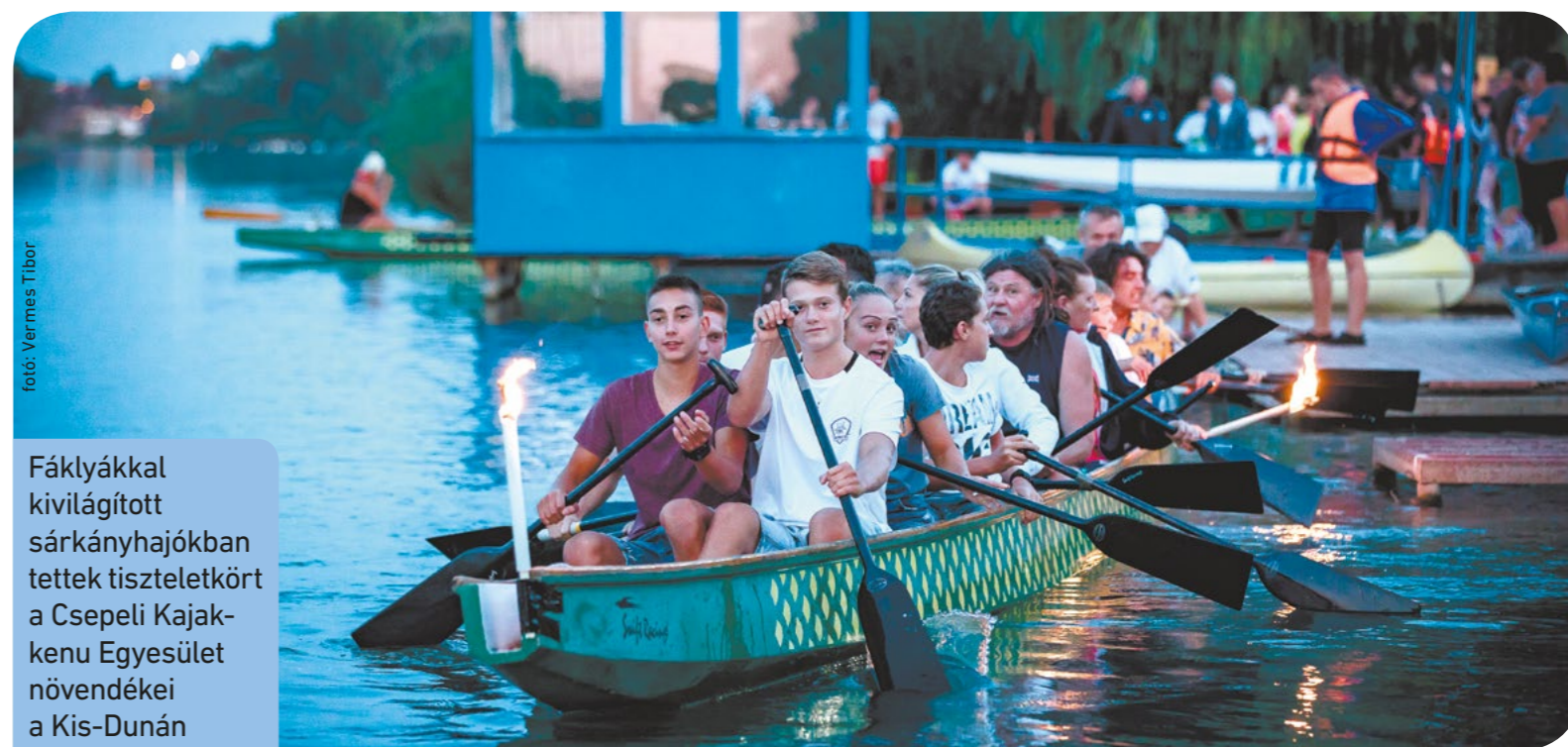
Fáklyákkal kivilágított sárkányhajókban tettek tiszteletkört a Csepeli Kajak-kenu Egyesület növendékei a Kis-Dunán

A helyezettek részt vehetnek a Magyarországi Önkormányzatok Országos Tanácsa által szervezett VI. Országos Szenior Rapid Sakkbajnokságon, amelyet szeptemberben rendeznek meg Nagykanizsán. A csepeli versenyzők szállását, útiköltségét és nevezési díját a csepeli önkormányzat fizette.