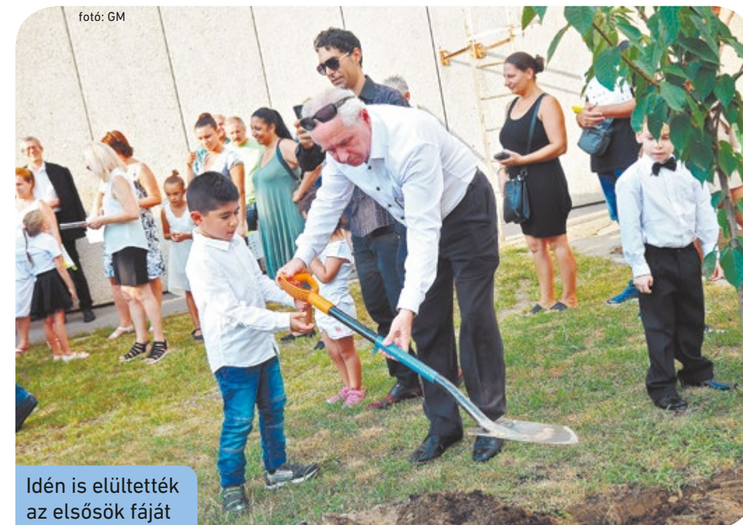
Idén is elültették az elsősök fáját

Ahogy már hagyomány, a tanévnyitó végén elültették az elsősök fáját. • A.Zs.