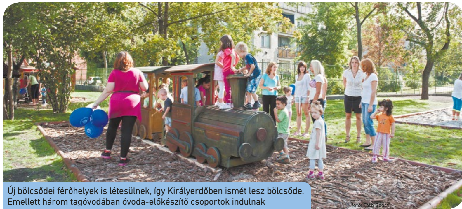
Új bölcsődei férőhelyek is létesülnek, így Királyerdőben ismét lesz bölcsőde. Emellett három tagóvodában óvoda-előkészítő csoportok indulnak

A Közrendvédelmi és Közbiztonsági Bizottság felmérte a kerületben közlekedő buszjáratokkal kapcsolatos lakossági igényeket, mely járatoknál lenne érdemes módosítani az útvonalat, növelni a járatsűrűséget. Ez alapján a bizottság javaslatot tett arra, hogy a reggeli és a délutáni csúcsidekban sűrítsék a 159-es járatot. A 179-es buszjáratnál kapcsolatban is több változtatást javasoltak. A Közvágóhídig közlekedő járatot meghosszabbítanák a Boráros térig, és hétfőig is működtetnék. A jelenleg félóránként közlekedő 179-es hétköznap negyedóránként járna. A testület felhatalmazta a polgármestert arra, hogy kezdjen egyeztetést a BKK-val a fejlesztési javaslatokról.