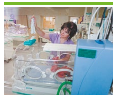
Családbarát szüléset a Jahn Ferenc kórházban