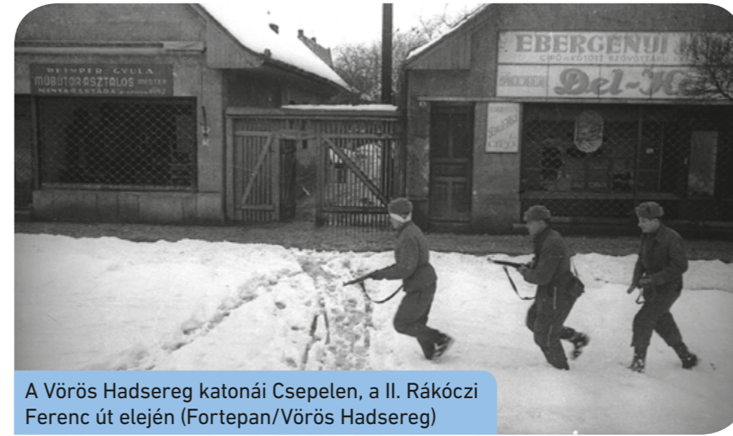
A Vörös Hadsereg katonái Csepelen, a II. Rákóczi Ferenc út elején

A Magyar Köztársaság Országgyűlése 2000. június 13-án fogadta el azt a határozatot, hogy február 25-ét a kommunista diktatúrák áldozatainak emléknapjává nyilvánítja. A szovjet hatóságok 1947-ben ezen a napon vették őrizetbe Kovács Bélát , a Független Kisgazdapárt főtítkárát a kommunistákkal szembeni kiállása miatt. A politikust a Szovjetunióba hurcolták, ahol különféle munkatáborokban, majd magyar börtönökben raboskodott összesen kilenc évig. Letartóztatásának napjától kezdődött a kommunisták térnyerése, majd diktatúrája Magyarországon.