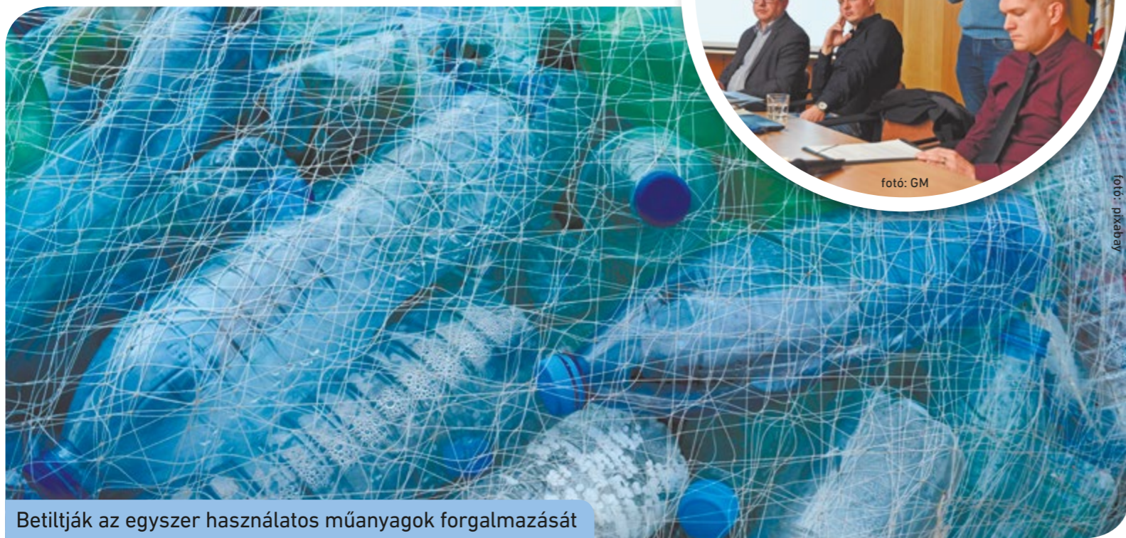
Betiltják az egyszerű használatos műanyagok forgalmazását