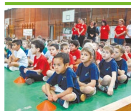
Sportfesztivál a csepeli óvodásoknak