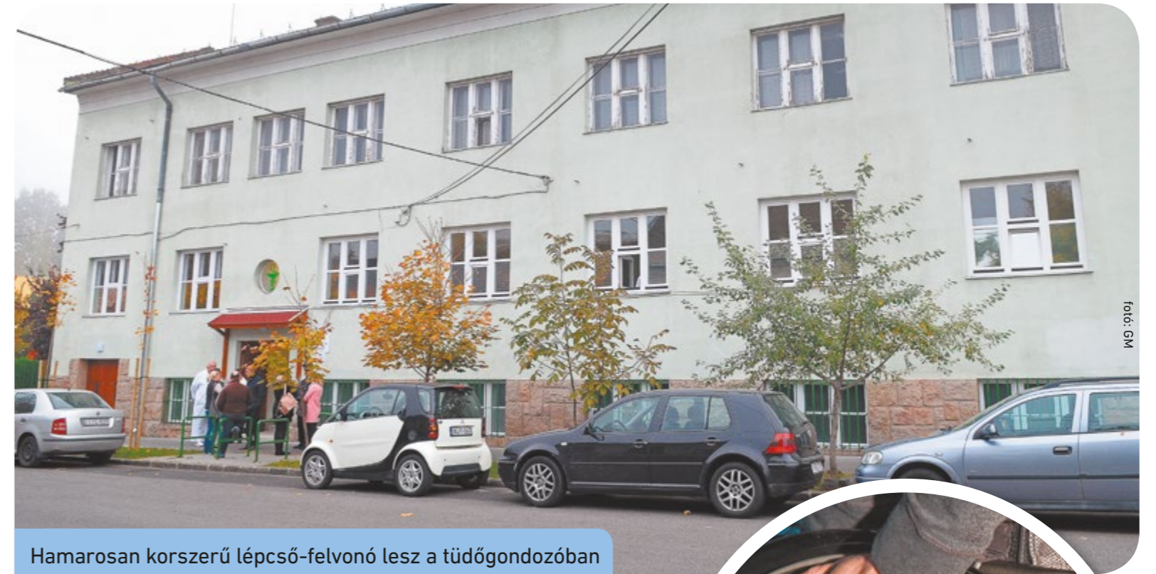
Hamarosan korszerű lépcső-felvonó lesz a tüdőgondozóban