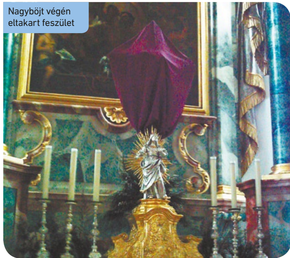
Nagyböjt végén eltakart feszület