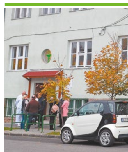
Akadálymentesítik a tüdőgondozót