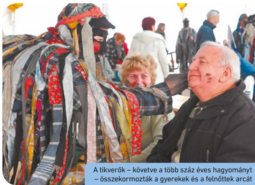
A tikverők – követve a több száz éves hagyományt – összekormozták a gyerekek és a felnőttek arcát

Már a kora reggeli disznóvágást és perzselést is sokan kísérték figyelemmel, majd a szép, napos időnek köszönhetően egyre többen látogattak ki a Királyerdei Művelődési Házhoz. A vendégeket a klasszikus disznótoros ételek mellett feldolgozott húsok, sajtok és kézműves termékek kínálata várta. A kilátogatóknak nemcsak gasztronómiai élményekben volt részük, ugyanis a művelődési ház egyik termében a disznóvágáshoz szükséges régi eszközökből (kolbásztöltő, zsírosbödön, daráló, kádak) nyílt kiállítás, ahol a disznó-