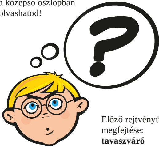
Előző rejtvényünk megfejtése: tavaszcserje

Rejtvényünk megfejtését a középső oszlopban olvashatod!