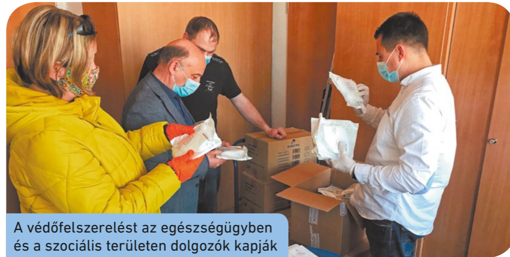
A védőfelszerelést az egészségügyben és a szociális területen dolgozók kapják

Mindeközben a csepeli egészségügyi fejlesztések is tovább folytatódnak: most egy motoros nőgyógyászati vizsgálószéket vásároltak a szakorvosi rendelő számára. Szakrendelésekkel kapcsolatos legfrissebb információk: tiesz.hu