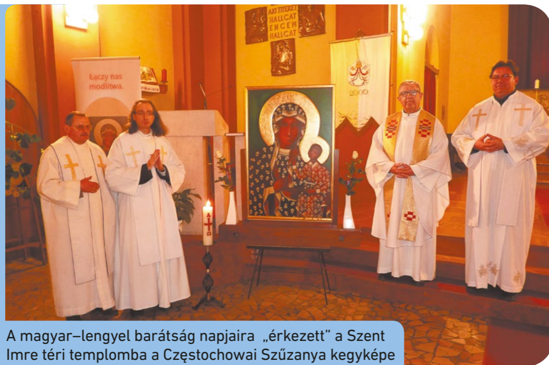
A magyar–lengyel barátság napjaira „érkezett” a Szent Imre téri templomba a Czeszochowai Szűzanya kegyképe