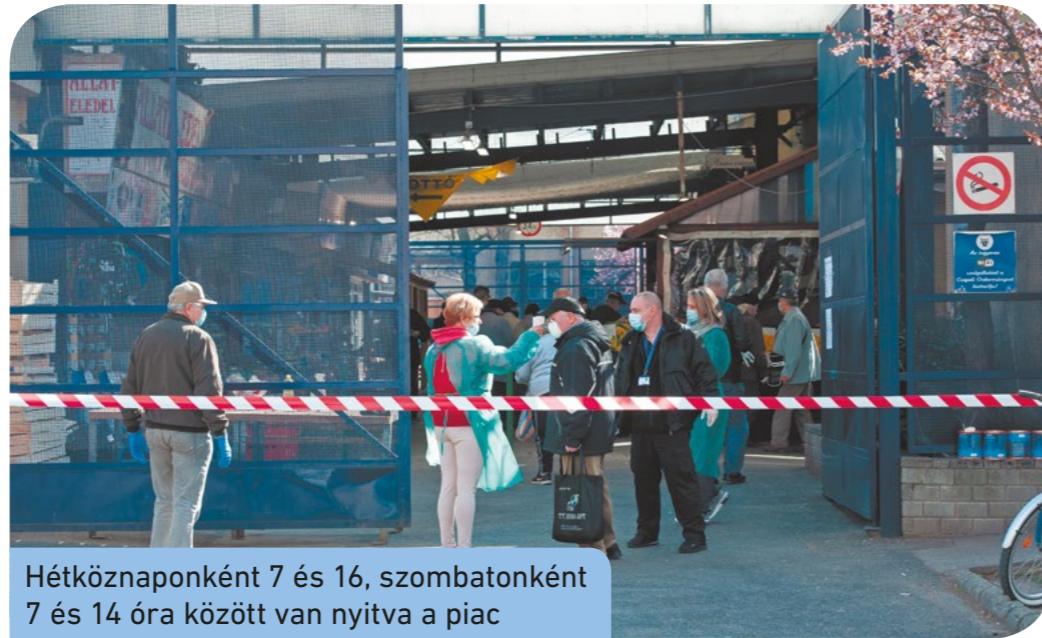
Hétköznaponként 7 és 16, szombatonként 7 és 14 óra között van nyitva a piac

Április 2-ától újra reggel 7-kor nyit a Csepeli Piac, így a 65 év alattiak 7 és 9, valamint 12 és 16 óra között tudnak ott bevásárolni. A 65 év feletti vásárlók – a kormány rendelete szerint – továbbra is kizárólag 9 és 12 óra között vásárolhatnak a veszélyhelyzetre való tekintettel. Szombatonként is hosszabb lett