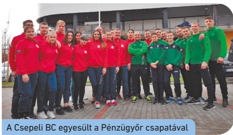
A Csepeli BC egyesült a Pénzügyőr csapatával