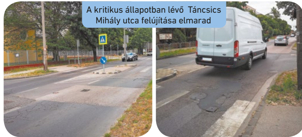
A kritikus állapotban lévő Tánccsics Mihály utca felújítása elmarad

„A Fővárosi Önkormányzat a következő négy évben egyetlen méter fővárosi út fel-