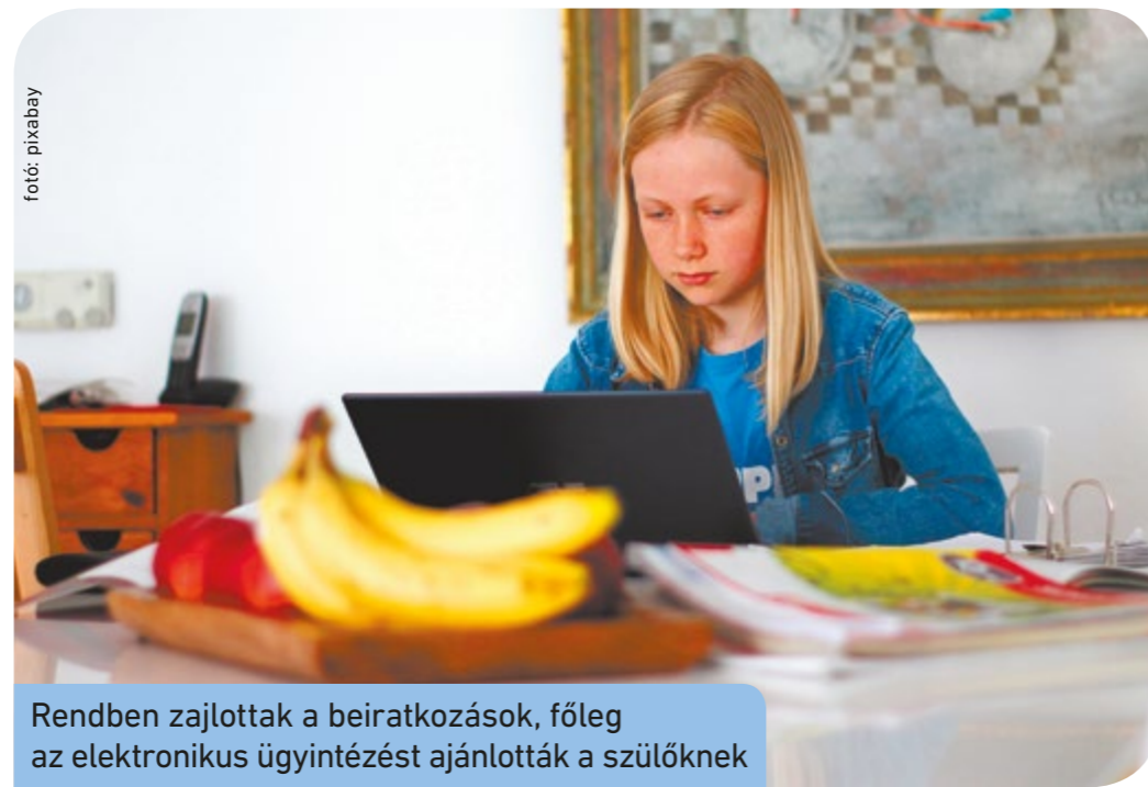
Rendben zajlottak a beiratkozások, főleg az elektronikus ügyintézés ajánlották a szülőknek

„Tisztelettel köszönjük a csepeli és soroksári pedagógusok áldozatos munkáját és a szülők támogató együttműködését”