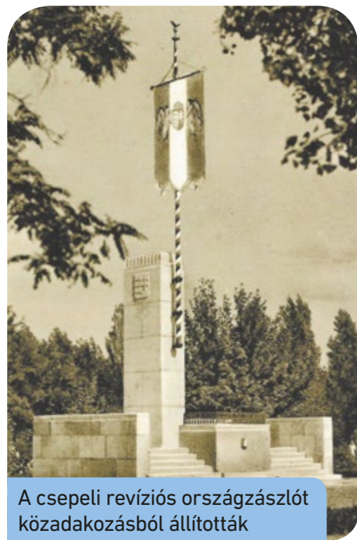
A csepeli revíziós országzászlót közadakozásból állították