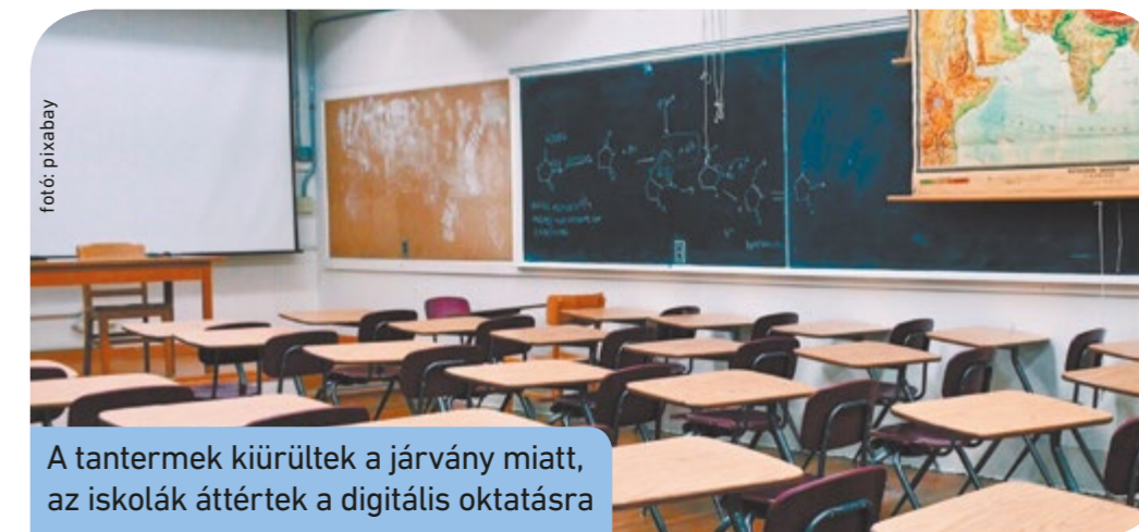
A tantermek kiürültek a járvány miatt, az iskolák áttértek a digitális oktatásra