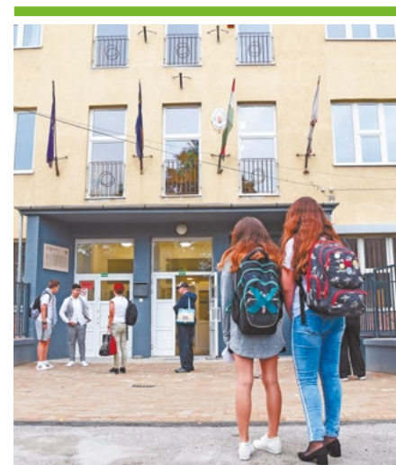
Iskolafelújítási program a kerületben