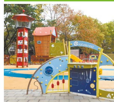
Megújult a Béke téri játszótér