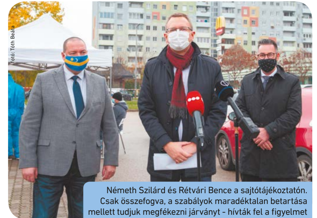
Németh Szilárd és Rétvári Bence a sajtótájékoztatón. Csak összefogva, a szabályok maradéktalan betartása mellett tudjuk megfékezni járványt - hívták fel a figyelmet