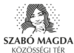
SZABÓ MAGDA KÖZÖSSÉGI TÉR

A ház hétköznaponként 8-16 óra között hívható a 278-27-47-es telefonszámon.