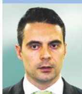
Vona Gábor (Jobbik):

„Az indítványok semmilyen valós intézkedést nem tartalmaznak a menekülthelyzet kezelésére, a kormány e helyett folytatja a menekültek alattomos megbélyegzését, a látszatintézkedések sorát, ami az adófizetők milliárdjaiba kerül.”