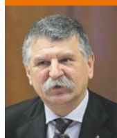
Kövér László (Fidesz):

„Aki arra akarja rávenni, pláne kényszeríteni a magyarokat, hogy – úgymond az európaiság jegyében – szakítsák el ezeréves gyökereiket, tagadják meg önazonosságukat, közösségeiket, hitünket és hagyományainkat, az vagy nem ismeri a magyarokat, vagy megveti mindazt, amit fontosnak tartanak az életben.”