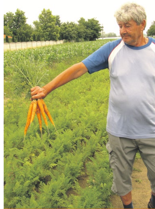
Kucseráék biozöldséget termelnek