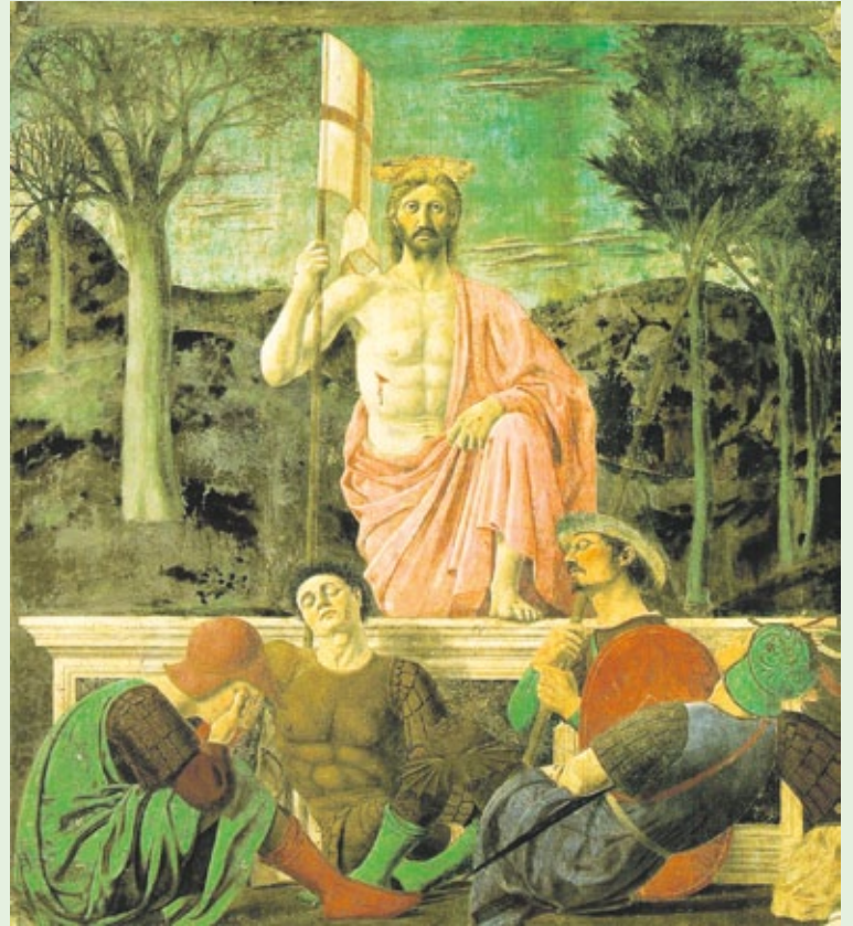
Krisztus feltámadása – Piero della Francesca (1420–1492)

A tojástörés hagyományáról beszél Szárkiszián Ádám, az Örmény Önkormányzat elnöke is. Elmondja: Örményországban a kisfiúk összeütik a főtt tojások tetejét, akinek hamarabb betörik, alulmarad. A gyerekek természetesen különféle trükkökkel igyekeznek minél ellenállóbbá tenni a tojás héját, például néhány órára, esetleg egy napra sóba teszik a már megfőtt tojásokat. A tojásokat nem a locsolásért kapják, mindenki magának festi. A lányok nem tavasszal, hanem nyáron tarthatnak a vizes meglepetésektől: ekkor van a vartavar szokása, amikor a hölgyek akár a nyílt utcán is kaphatnak vizet a nyakukba. Szarkiszián Ádám kiemeli: Örményország a világon elsőként tette államvallássá a katolikus hitet, az apostoli ortodox hit központja a fővárostól néhány kilométerre található. Idén a húsvét egybeesik a katolikus ünnepel, Csepelen március 29-én apró ajándékokkal, ünnepi programmal készülnek az örmény gyere-