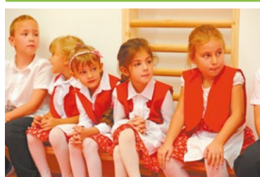
Új tornaszoba a Zsongás óvodában