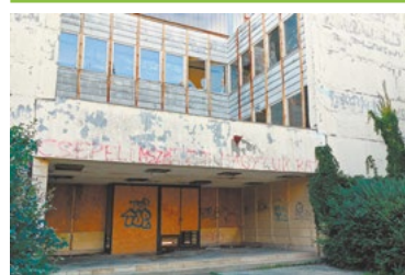
Hajléktalanszálló is lehet a volt iskolából?