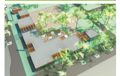
Főtéri pavilonok: a kérdőív eredménye