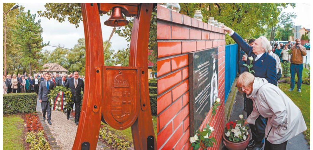
A harangláb megkoszorúzása után az emléktáblához vonultak át a résztvevők

Németh Szilárd boldog Jerzy Popiełuszko lengyel pap születésének hetvenedik évfordulója alkalmából a Facebook-oldalán történeteket és emlékképeket osztott meg a szolidaritás pásztoráról.