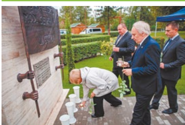
Jerzy Popiełuszko- emlékművet avattak