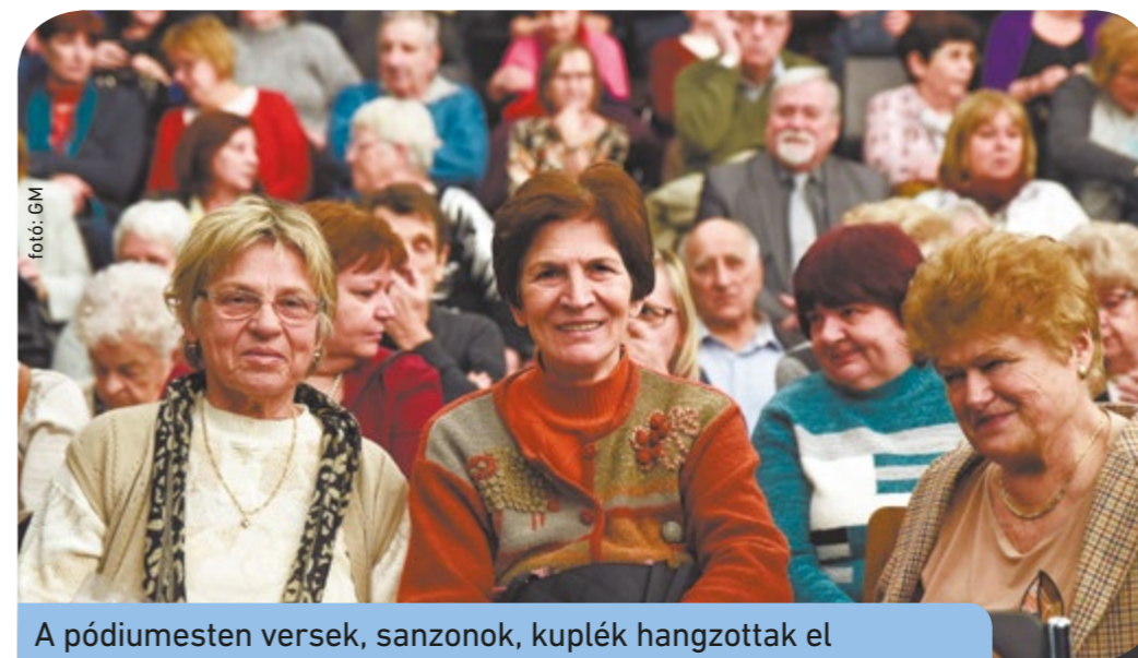
A pódiumesten versek, szonok, kuplák hangzottak el

A fellépésekről kérdezve a művész elmondta, hogy néhány hónapja mutatták be a Kálmán Imre életéről szóló darabot, melyet nagy sikerrel, telt ház előtt játszanak a Spinoza Színházban. „Bár az energiámhoz képest most kicsit kevesebbet dolgozom, főként filmes munkák, irodalmi estek adnak feladatot, ez nem okoz lelki bánatot. Szerencsés alkat vagyok, mindig megtalálom, ami örömet szerez számomra, és amivel a közönségnek is örömet szerezhetek.” • PE