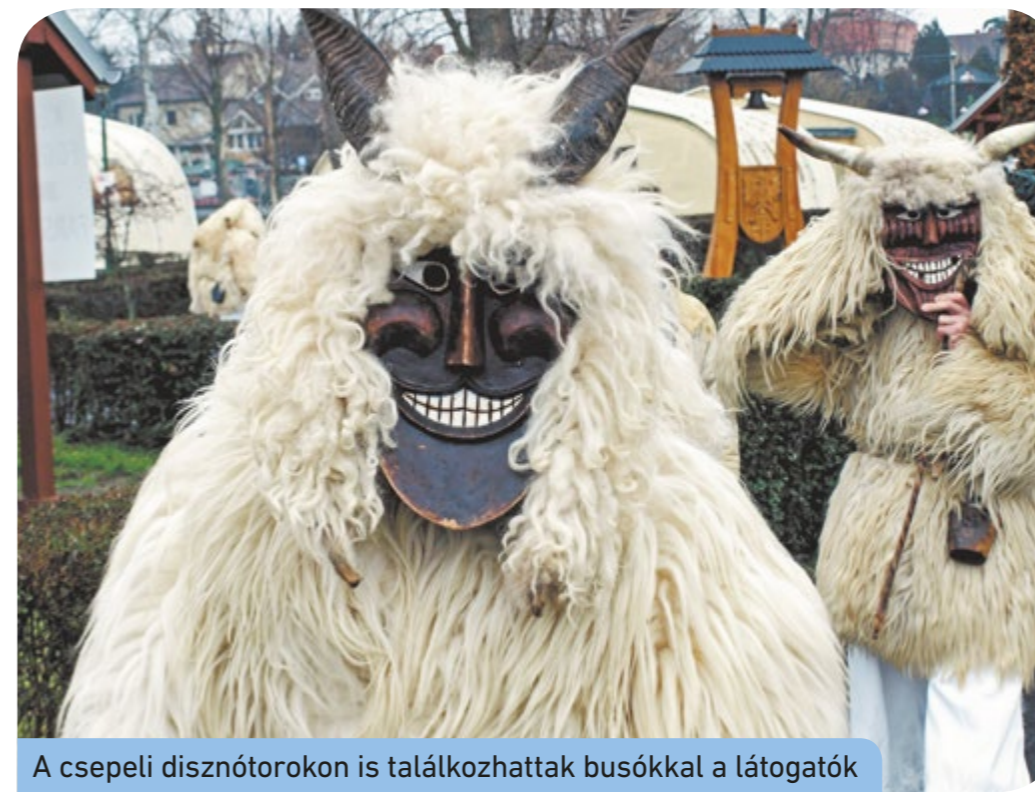
A csepeli disznótorokon is találkozhattak busókkal a látogatók

Magyarországon ma a legismertebb farsangvégi népszokás a Mohácson lakó délszlávok (sokácok) álarcos, jelmezes