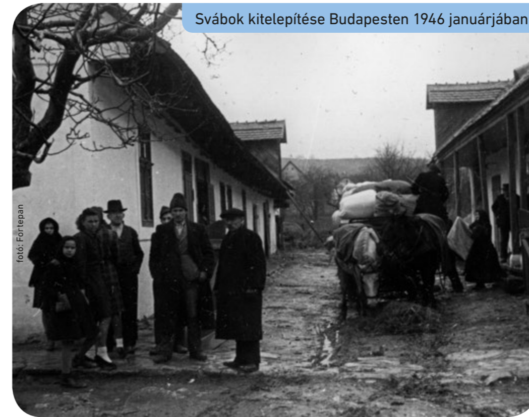
Svábok kitelepítése Budapesten 1946 januárjában