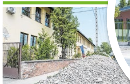
Iskolafelújítási program 5. OLDAL