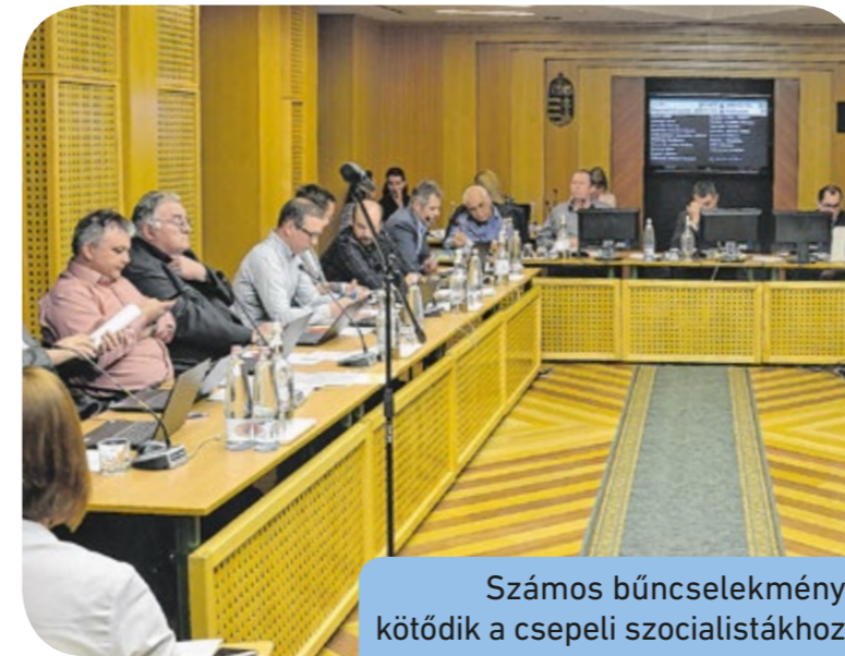
Számos bűncselekmény kötődik a csepeli szocialistákhoz