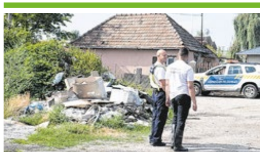
Akciócsoport a szemetelők ellen 3. OLDAL