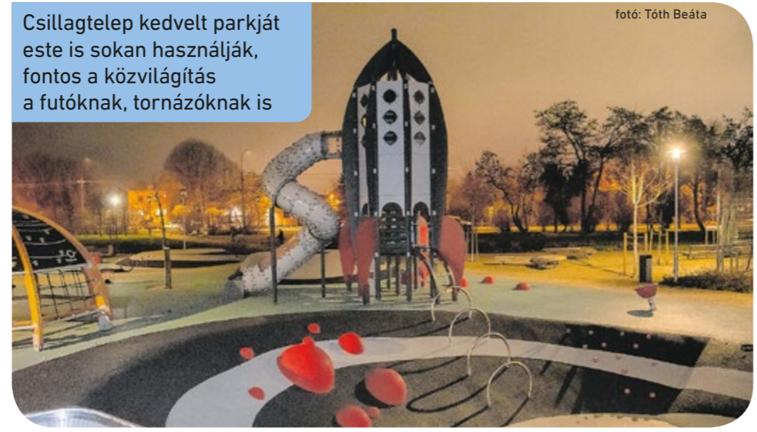
Csillagtelep kedvelt parkját este is sokan használják, fontos a közvilágítás a futóknak, tornázóknak is

lágítás hiányát kihasználó vandálok pusztítását nem tudják pótolni. „Az öltözőszekrényes pad esetében viszont az ésszerűség elve mentén kellett döntést hoznunk. Mivel folyamatos a rongálásuk, kamerarendszer vagy közterület-felügyeleti jelenlét nélkül értelmetlen a javításuk. Egy számszoros ajtó cseréje 160 ezer forint. Erre – a sajnos visszatérő kiadásra – az idei megszorításokkal terhelt évben a forrás nem biztosított. Így egyelőre a hibás ajtókat elszállítjuk, így a pad ülőbütorként, illetve elektronikai eszközök töltésére alkalmas.” – fogalmaznak. A terület megkeresése és a főváros válasza után a virágágyások rendbetétele megkezdődött, ám a világítás továbbra sem működött.