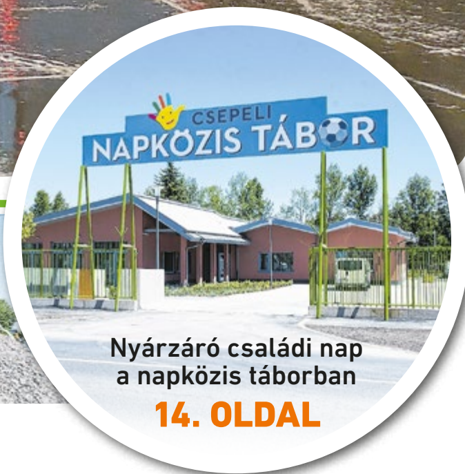
Nyárzáró családi nap a napközis táborban