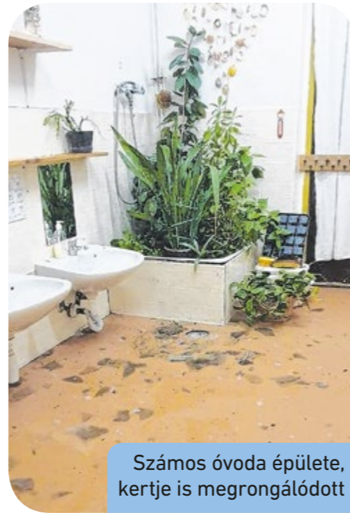
Számos óvoda épülete, kertje is megrongálódott

A Csepeli Városgazda Zrt. munkatársai a vihar után folyamatosan végezték a kárenyhítést. A kerület központi területein jelentősen megrongálódtak a virágágyások, a különféle cserjék, növények, valamint a villanyoszlopokra kihelyezett muskátlik is. Egy kosaras autóval és egy favágóval megkezdtek a kármentesítést Csepel utcáin. Azonnali feladatként eltávolították a letört faágakat a kapubejárók elől és a járdákról. Több fa is súlyosan megsínylette a heves vihart, ezért a balesetveszély elhárítása érdekében tíz darabot kivágtak. Kიდőlt, megsérült fákat kellett legallyazni, megóvni a kipusztulástól a Deák térnél, a Kossuth Lajos utcában és az Ady End-