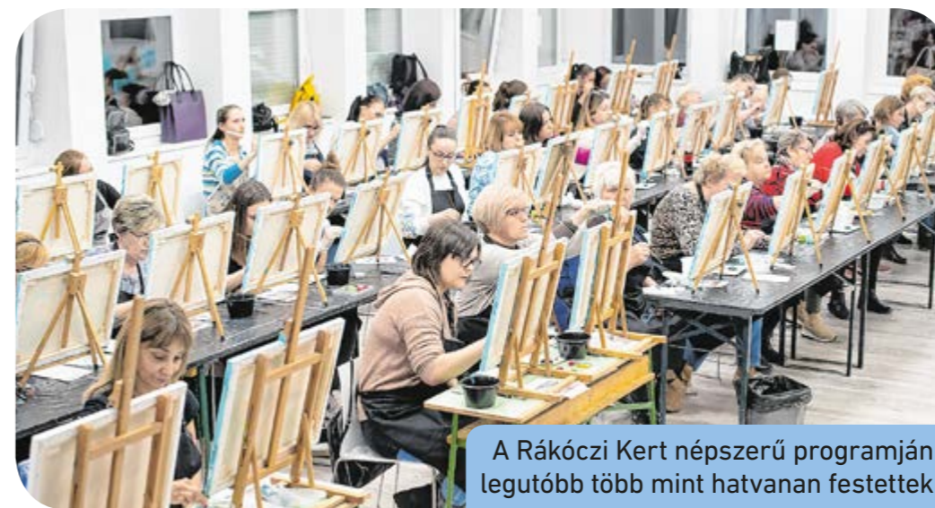
A Rákóczi Kert népszerű programján legutóbb több mint hatvanan festettek