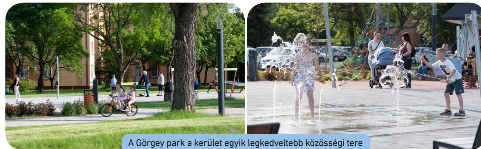
A Görgy park a kerület egyik legkedveltebb közösségi tere

„Csepelen rengeteg közösségi teret építettünk a családoknak, elég, ha csak a Rákóczi Kertre, a megújult napközis táborra vagy éppen a Kalózhajós játszótérre gondolunk. A gyerekek biztonsága érdekében az itt lévő játszóeszközöket folyamatosan karbantartjuk, ahogy megteszük ezt az egyéb játszótérek is. A Tárház utcai játszótérnél a gumiburkolatot cseréltük nemrég, jelenleg pedig a Csikó sétányánál lévő játszótérnél dolgoznak a Városgazda munkatársai, ahol festeni fogják a játékokat, és gumiburkolatra cserélik a használt műfüvet” – írta közösségi oldalán Borbély Lénárd polgármester.