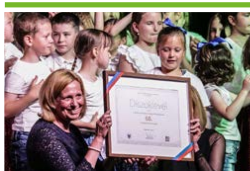
Hat évtized, hatvan program 8. OLDAL