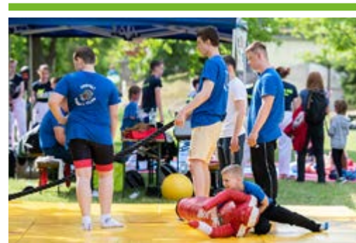
Családi sportnap a strandon 16. OLDAL