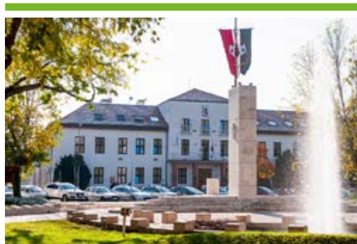
Testületi ülés májusban 2. OLDAL