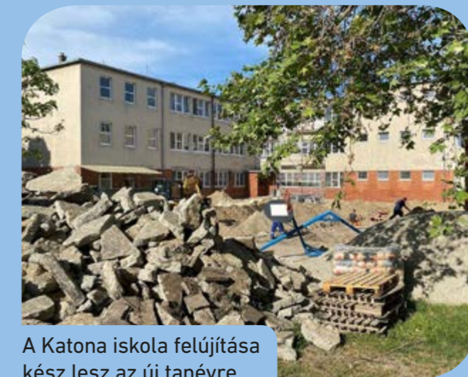
A Katona iskola felújítása kész lesz az új tanévre

megújul a Katona József Általános Iskola. A Csepeli Gyermeksziget Program részeként minden iskolát (is) fel fogunk újítani” – írta Facebook-bejegyzésében Borbély Lénárd polgármester.