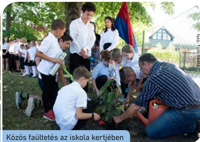
Közös faültetés az iskola kertjében