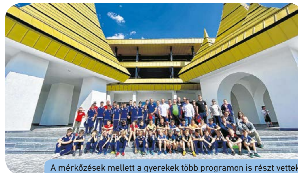
A mérkőzések mellett a gyerekek több programon is részt vettek

A tornát a csepeli önkormányzat és Magyarország Csíkszeredai Főkonzultusa közösen szervezte, házigazda a Székelyföld Labdarúgó Akadémia és az FK Csíkszereda volt, az esemény fővédnöke pedig Kövér László , a Magyar Országgyűlés elnöke. A székely-magyar labdarúgótornák megszervezésében tett munkájáért Borbély Lénárd emlékplakettet vehetett át.