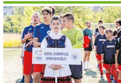
Székely–magyar focitorna 14. OLDAL