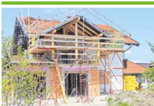
Jogszerűtlen építkezések 4. OLDAL