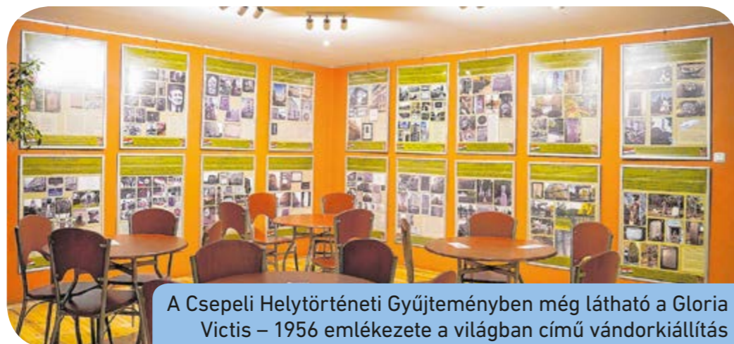
A Csepeli Helytörténeti Gyűjteményben még látható a Gloria Victis – 1956 emlékezete a világban című vándorkiállítás

délyi magyar humorista szórakoztatta a közönséget, végül a Dirty Slippers zenekar élő koncertje az estét. A színpadi műsorok mellett Trianon-totóval, Trianon-felfedező játékkal és kézműves-foglalkozásokkal – mint például a délvidéki csigatészta-készítés – is készültek a szervezők.