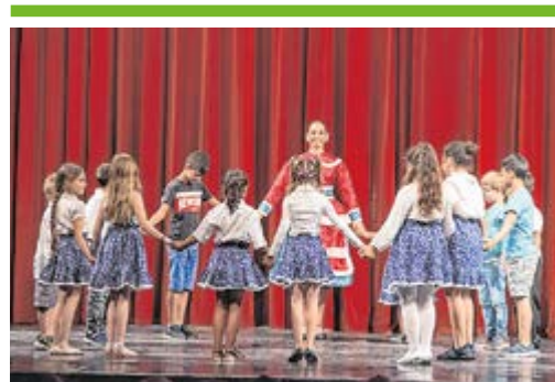
Öt évtized: születésnap gála 10. OLDAL