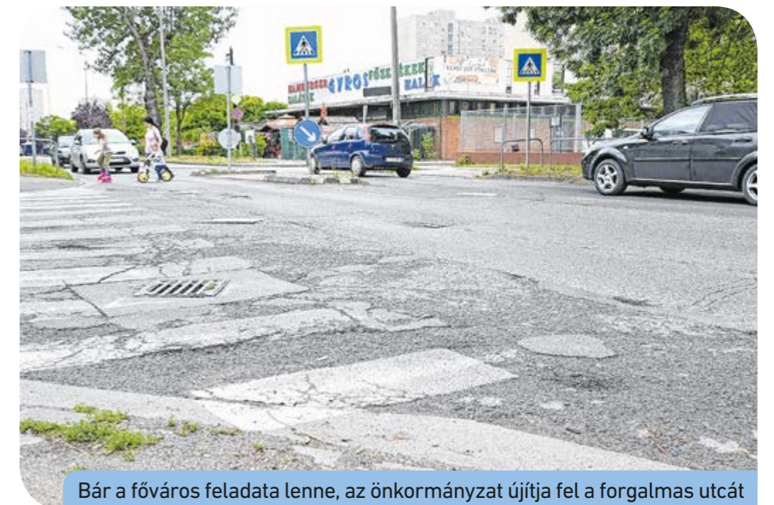
Bár a főváros feladata lenne, az önkormányzat újítja fel a forgalmas utcát

„Kérem a csepeliek, a közlekedők szíves türelmét! Mindent meg fogunk tenni a munkálatok mielőbbi elindulásáért és annak gyors befejezéséért!” – zárta sorait a polgármester.