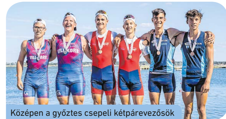
Középen a győztes csepeli kétpárevezősök