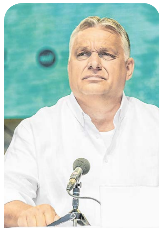
Orbán Viktor miniszterelnök

Orbán Viktor miniszterelnök július 23-ai beszédében több témát is érintett: beszélt az Európai Unióval való kapcsolatáról, az orosz–ukrán háború hatásairól, a gazdasági recesszióról. A veszélyek, a bizonytalanság és a hábo-