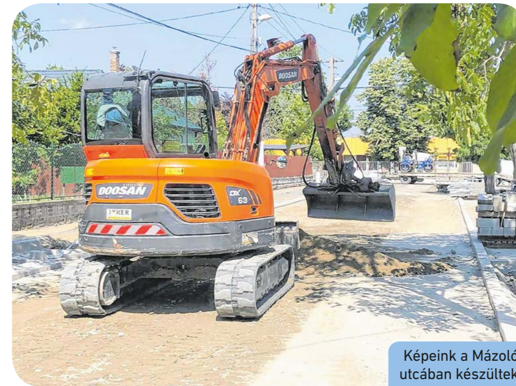
Képeink a Mázoló utcában készültek

lenlegi polgármesteri ciklusa alatt már 17 kilométer új utcát, új járdát és csapadékvíz-csatornát építettek meg a kerületben. Ez egyrészt a önkormányzati pénzből, másrészt a kormánytól kapott támogatásból valósulhatott, valósulhat meg. Az útépitések a nyári időszakban sem álltak le: júniusban is több utcában dolgoztak egyszerre, ilyen a Zsilvölgyi, a Kököröcsin, a Repkény és a Mázoló utca.