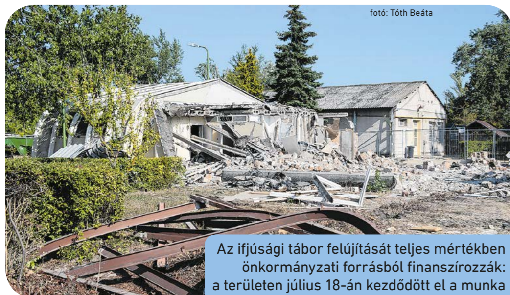
Az ifjúsági tábor felújítását teljes mértékben önkormányzati forrásból finanszírozzák: a területen július 18-án kezdődött el a munka

A teljes mértékben önkormányzati forrásból finanszírozott, a mintegy két hektáron elindult felújítás során elbontják a rossz állapotban lévő pavilon- és öltözőépületeket, új vendéglátóhelyet kerthelyiséggel, játszóteret, gyalogos sétányokat, parkolóhelyeket hoznak létre, utcabútorokat helyeznek ki, felújítják a meglévő csónakházat, teniszpályákat alakítanak ki, új vizesblokkokat, tábort szálláshelyeket, tanári és egészségügyi szobát, valamint konyhát építenek. Ugyanakkor a zöldfelület és a növényállomány is megújul, automata öntözőrendszert telepítenek – ismertette a polgármester. Egyúttal hangsúlyozta: a lakosság, az önkormányzat és a helyi civilszervezetek (a Csepelért Lokálpatrióta Egyesület és a Csepeliek a Zöld Kis-Duna-partért Egyesület) felújítással, fejlesztéssel kapcsolatos