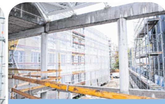
Képeink az épülő gimnázium bejárásán készültek