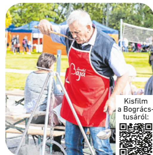
Kisfilm a Bográcsstusáról: