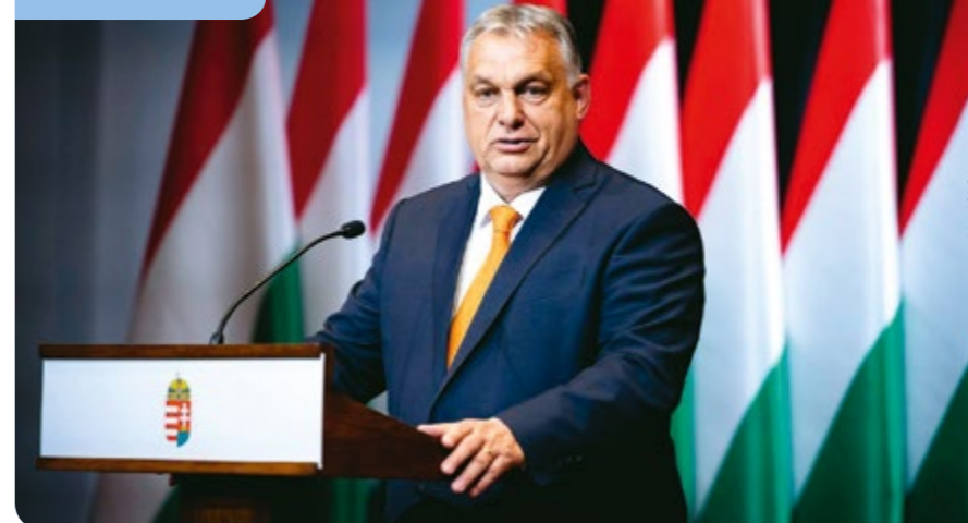
Orbán Viktor miniszterelnök

Beszédében elhangzott, hogy a kormány bevezeti a kedvezményes havi vármegyebérletet (9450 forint) és az országbérletet (18900 forint). Végül pedig azt ígérte, Magyarország a béke és biztonság szigete marad.