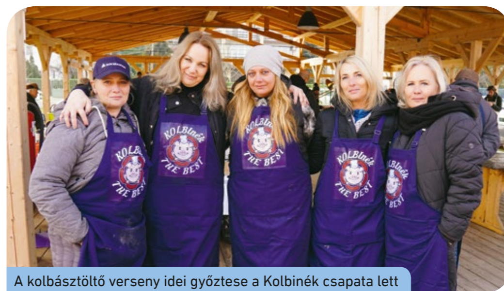
A kolbásztöltő verseny idei győztese a Kolbinék csapata lett

tek kolbászt, nagyon kedvelem ezt a tevékenységet, most is van a füstölőmben negyven kilogramm. A családnak, barátoknak is szívesen ajándékozok a saját készítésű kolbászokból”.