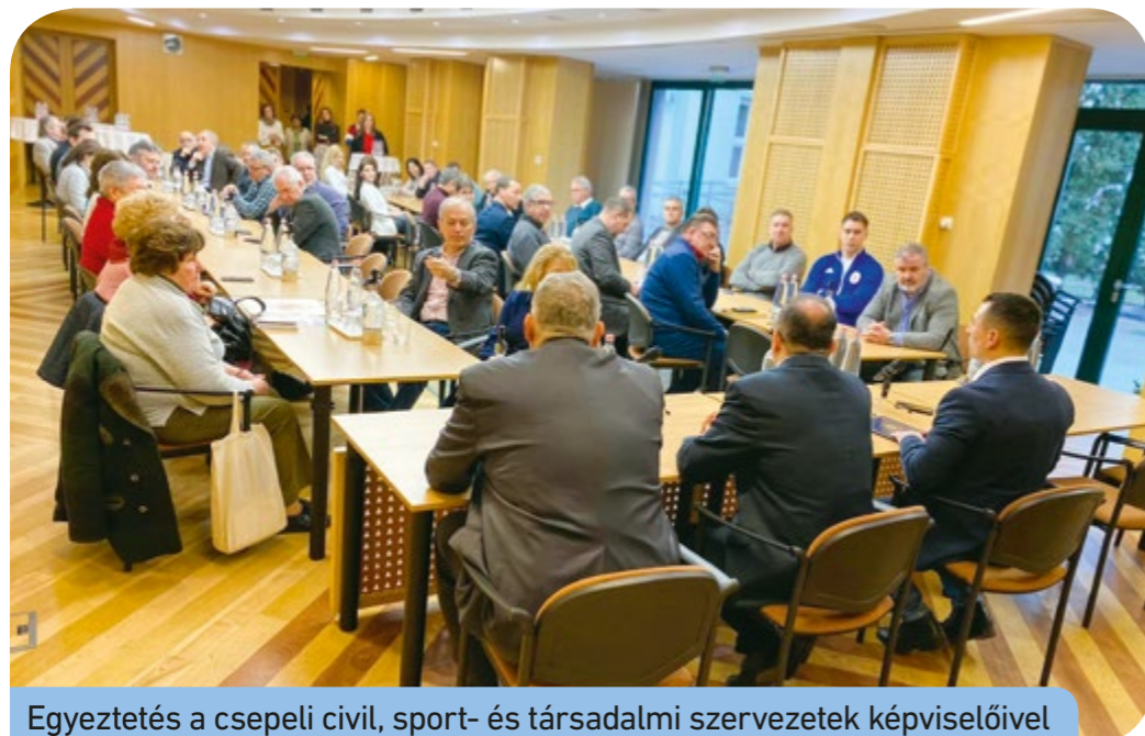
Egyeztetés a csepeli civil, sport- és társadalmi szervezetek képviselőivel