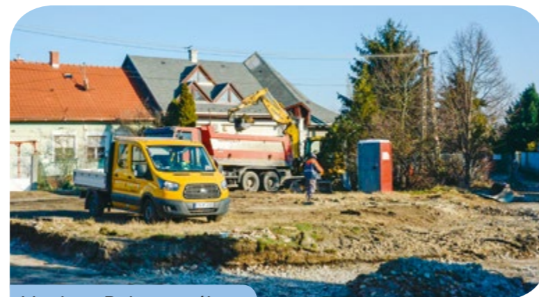
Munka a Dabas utcában

A kerület más részein is épülnek az utak. Készül a Dabas utca, a következő helyszínek a Szigetújfalu, a Bodzás és a Dinnyés utca. Az útépitéseket addig folytatja az önkormányzat, míg az összes utca meg nem újul a kerületben.