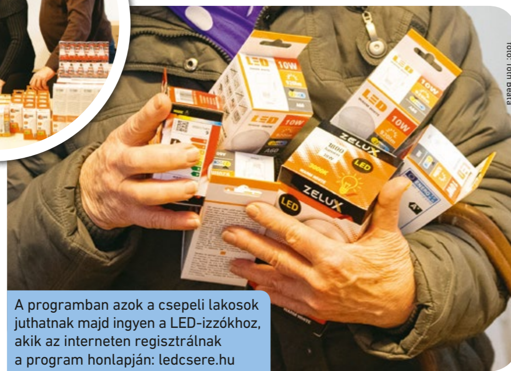
A programban azok a csepeli lakosok juthatnak majd ingyen a LED-izzókhoz, akik az interneten regisztrálnak a program honlapján: ledcsere.hu