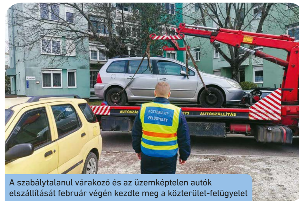
A szabálytalanul várakozó és az üzemképtelen autók elszállítását február végén kezdte meg a közterület-felügyelet

Közterület-fenntartó Zrt. gépjárműveit a kommunális hulladékok elszállításában. A fokozatosság elvét betartva a közterület-felügyelet már 2023. január eleje óta több alkalommal is figyelmeztette a Kossuth Lajos utca 112–120. szám előtti gépjárművek tulajdonosait, üzemeltetőit. „Mivel a figyelmeztetések eddig sajnos nem vezettek eredményre, és a gépjárművek tulajdonosai továbbra is akadályozzák az FKF Zrt. hatékony működését, ezért rákényszerültünk arra, hogy erről a területről a járműveket elszállítsassuk” – áll a közleményben.