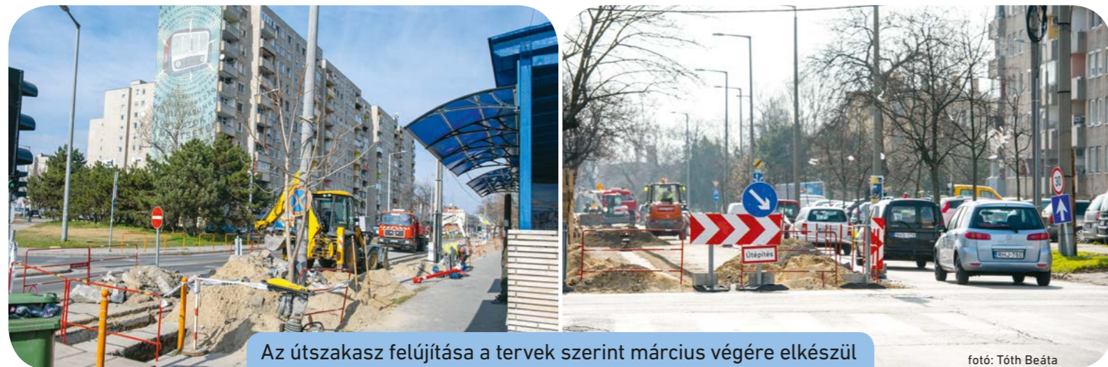
Az útszakasz felújítása a tervek szerint március végére elkészül

A második szakaszt – a Szent István és a Széchényi utca közötti részt – várhatóan 2023 márciusának végén adják át a forgalomnak. Az útpályán kívül az ivóvízvezeték is megújul. A munkálatok félpályás útlezárással járnak, kéri az arra járók türelmét.