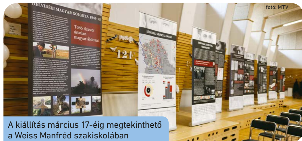
A kiállítás március 17-éig megtekinthető a Weiss Manfréd szakiskolában