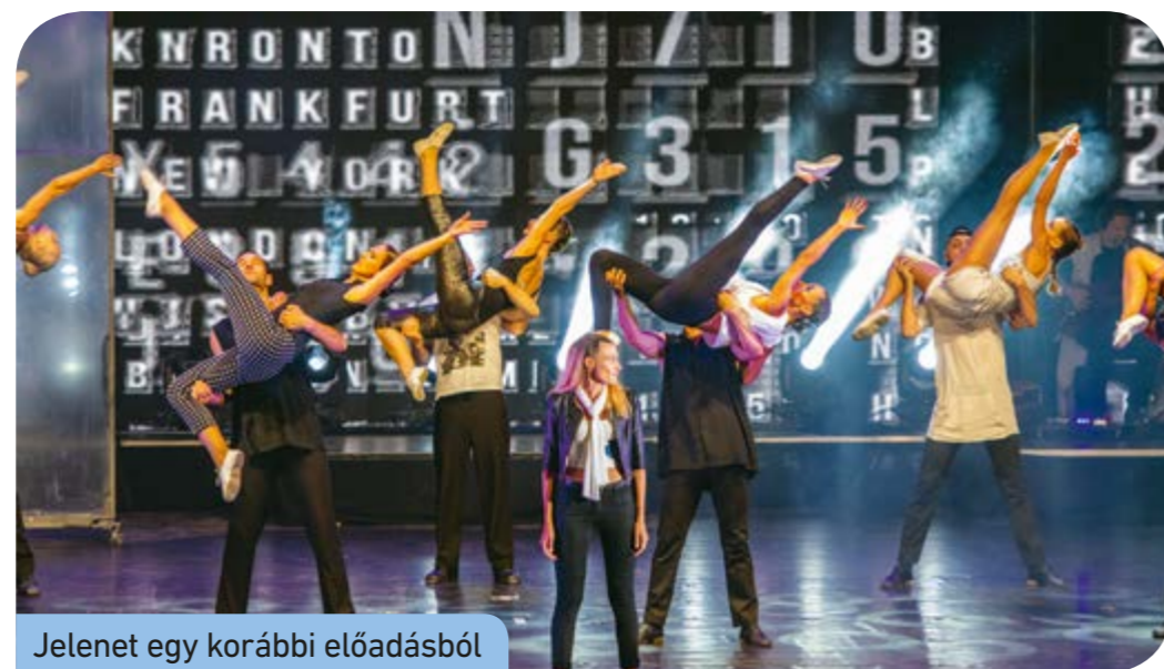
Jelenet egy korábbi előadásból

Az előadás látványvilágát több mint ötven négyzetméteres LED-fal erősíti. A musical minden korosztály számára remek szórakozást ígér. A nézők a régi slágereket felidézve nosztalgizhatnak és emlékezhetnek az Omega együttes tagjaira. • Potondi Eszter