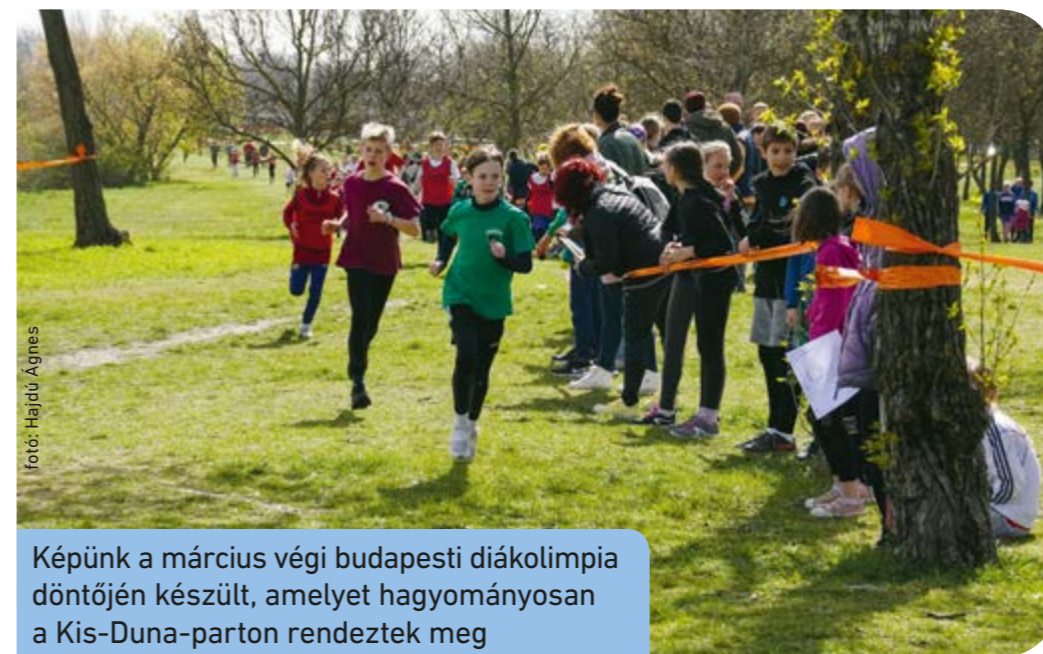
Képünk a március végi budapesti diákolimpia döntőjén készült, amelyet hagyományosan a Kis-Duna-parton rendeztek meg