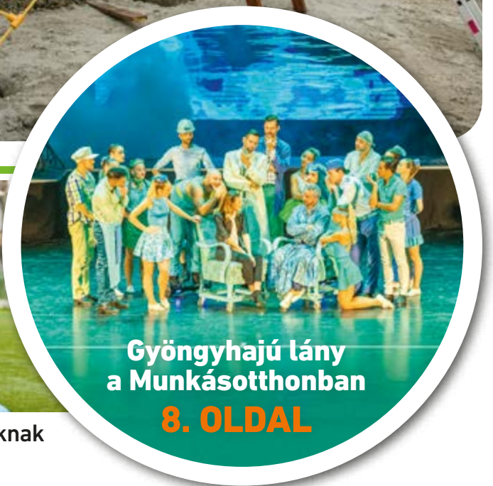
Gyöngyhajú lány a Munkásotthonban 8. OLDAL