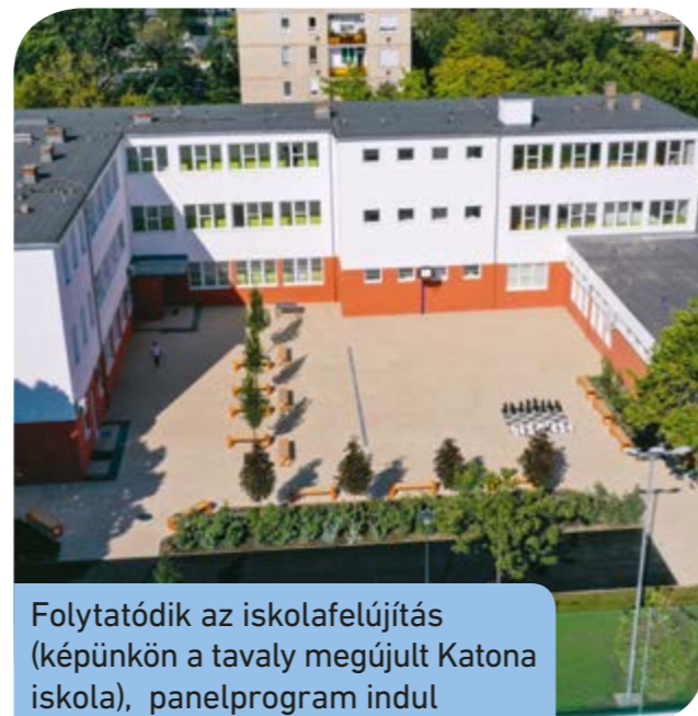
Folytatódik az iskolafelújítás (képként a tavaly megújult Katona iskola), panelprogram indul

Bármi is történik, Csepel érdekeiből nem tudok engedni. Nem engedjük magas épületekkel beépíteni a csepeli Kis-Duna-partot, nem adjuk át a Csepeli Munkásotthont magánalapítványba. Ebből adódtak a konfliktusaink, és kétségtelen, hogy ezek után kiala-