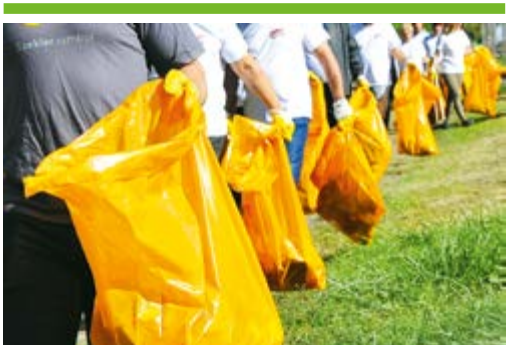
Szemétszedési akció a Föld napján 3. OLDAL