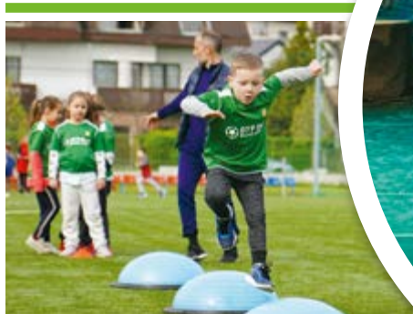
Bozsik-fesztivál óvodásoknak 14. OLDAL