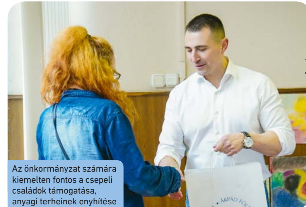
Az önkormányzat számára kiemelten fontos a csepeli családok támogatása, anyagi terheinek enyhítése

Míndezek mellett tovább folytatjuk az utépítéseket, közösségi tereket újítunk meg, a Csepeli Zöld Sziget Program keretében rengeteg új fát ültetünk és