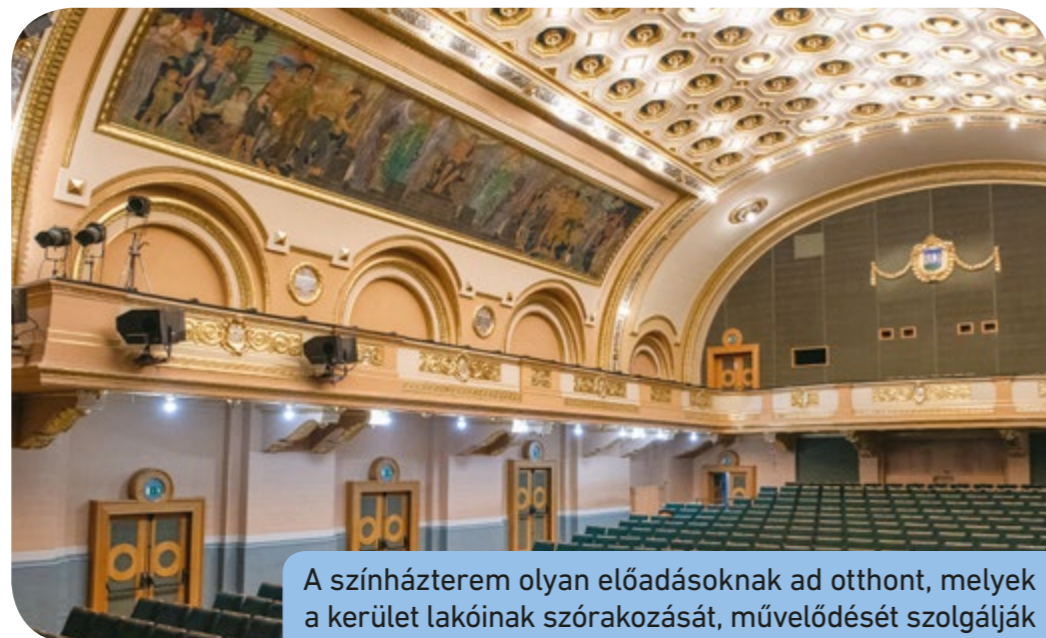
A színházterem olyan előadásoknak ad otthont, melyek a kerület lakóinak szórakozását, művelődését szolgálják