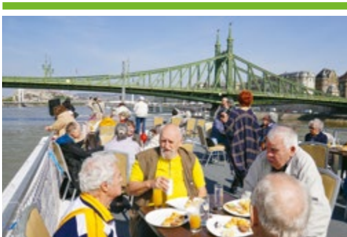
Csepeli nyugdíjasok a fedélzeten 13. OLDAL