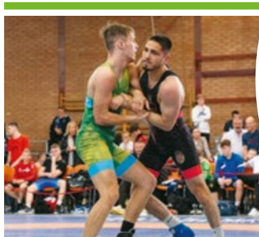
Négy arany birkózásban 16. OLDAL