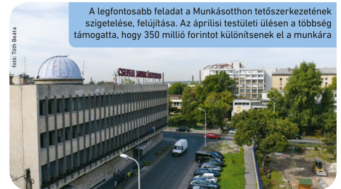
A legfontosabb feladat a Munkásotthon tetőszerkezetének szigetelése, felújítása. Az áprilisi testületi ülésen a többség támogatta, hogy 350 millió forintot különítsenek el a munkára

örökségének részeként tekint rá, támogatását minden területen érzékelik. „A Munkásotthon életében egy új korszak kezdődött el, a megújulás időszaka. Ezt az épületre és az itt folyó szakmai munkára egyaránt értem. Haladnunk kell a korral, de megőrizve a hagyományteremtő, érték közvetítő jellegünket” – tette hozzá. • Potondi Eszter