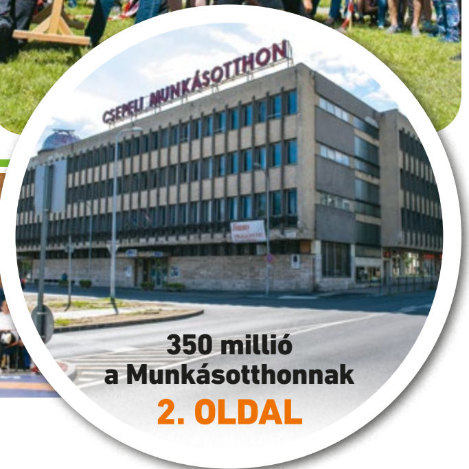
350 millió a Munkásotthonnak 2. OLDAL