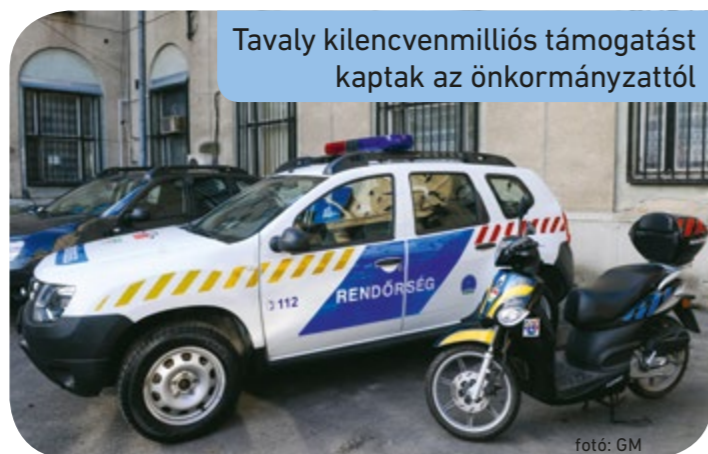
Tavaly kilencvenmillió támogatást kaptak az önkormányzattól

A csepeli rendőrkapitányság példamutatóan jó kapcsolatot ápol a csepeli önkormányzattal, amely tavaly 90 millió forinttal támogatta a rendőrség munkáját. A rendőrség a közterületi jelenlét fokozására különösen nagy hangsúlyt fektet. Az önkormányzat 180 millió forintos beruházással felújította a kerületben működő térfigyelő kamerákat, amelyek komoly segítséget nyújtanak a nyomozások során és a bűnmegelőzésben. A rendőrség szintén jó együttműködésben dolgozik a csepeli közterület-felügyelettel és a Dél-Csepel Polgárőr Egyesülettel. • Cs. A.