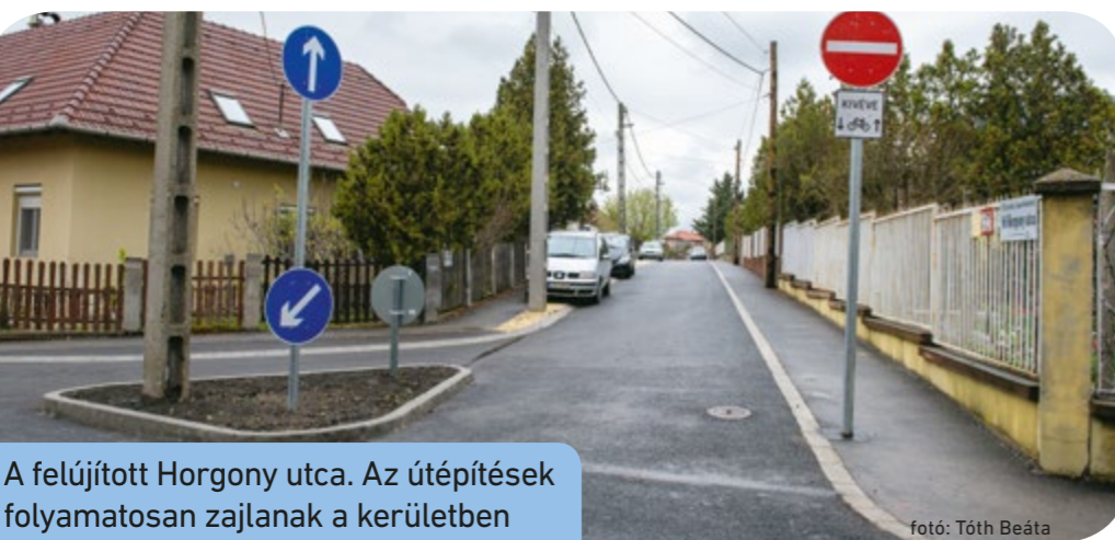
A felújított Horgony utca. Az útépitések folyamatosan zajlanak a kerületben