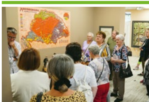
Emlékezés a trianoni tragédiára 6. OLDAL