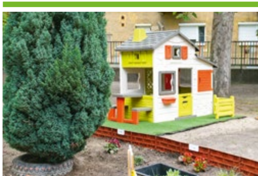
Megújult a baptista óvoda udvara 4. OLDAL