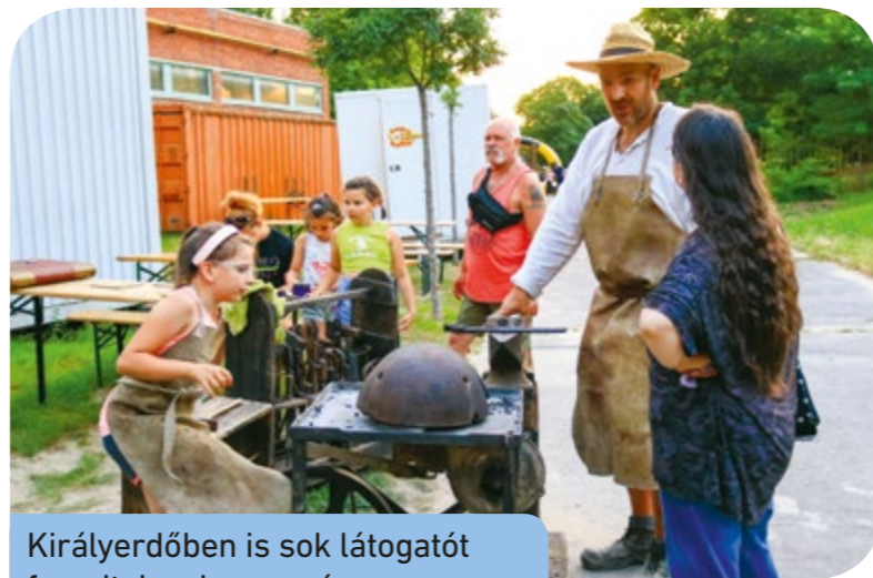
Királyerdőben is sok látogatót fogadtak, a hagyományos szalonnasütés idén sem maradt el