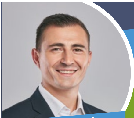
BORBÉLY LÉNÁRD Csepel polgármestere