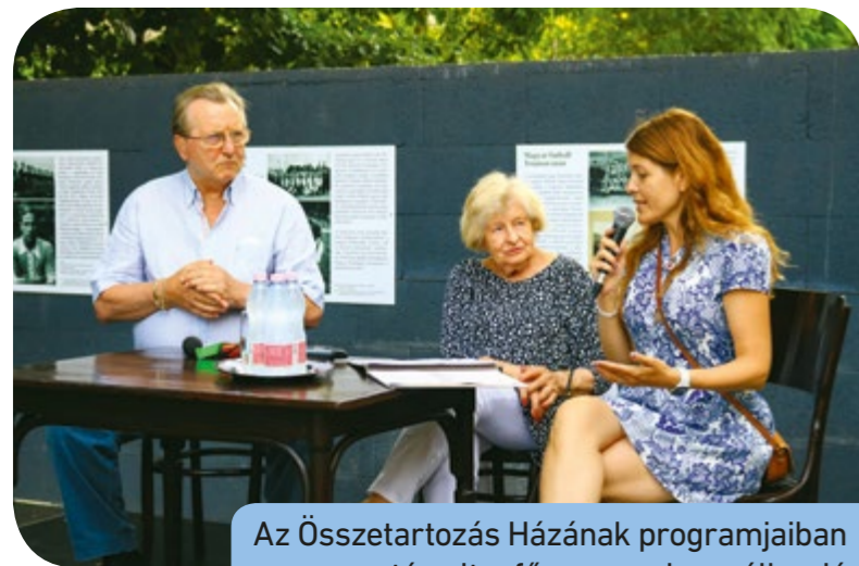
Az Összetartozás Háza programjaiban a sporté volt a főszerep, de az állandó kiállításra is sokan voltak kíváncsiak