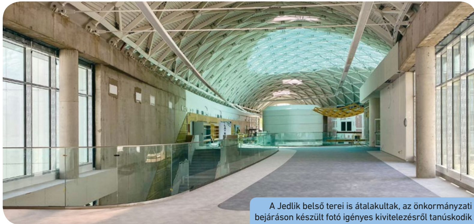
A Jedlik belső terei is átalakultak, az önkormányzati bejárásról készült fotó igényes kivitelezésről tanúskodik