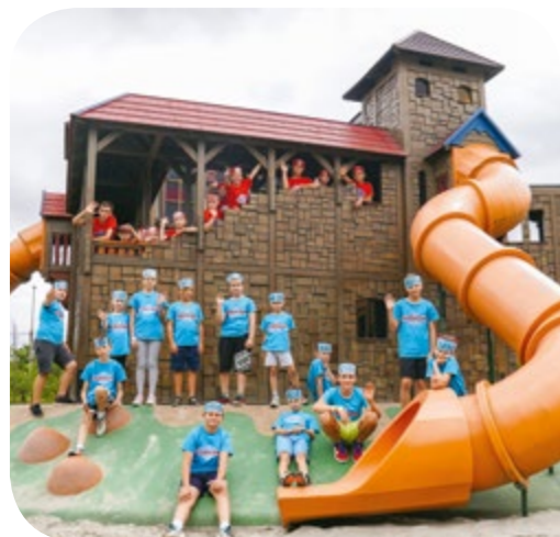
Az élménynapok a VEKOP-6.2.1-15-2016-00006 azonosítószámú „Csillagtelep szociális célú rehabilitációja” elnevezésű projekt keretében valósulnak meg.