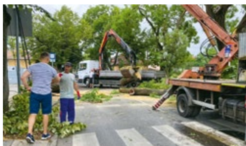
Vihar után: szervezeten haladt a kármentesítés