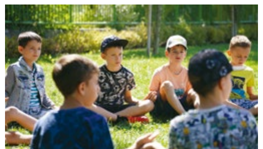
Napközis tábor a szünidőben: kirándulások, játékok, sport