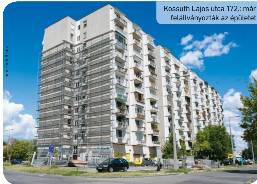
Kossuth Lajos utca 172.: már felállványozták az épületet

A csepeli önkormányzat Csillagtelep szociális célú rehabilitációja program keretében 2017 decemberében bruttó 1 699 755 944 forint összegű támogatást nyert. A projekt részét képezte tizenegy csillagtelepi társasház energetikai felújítása. A projekt valahogy mégsem akart elindulni. 2019-re persze jelentősen megemelkedett a kivitelezés ára, ezzel együtt az önkormányzat városfejlesztési cégének akkori vezetője semmilyen előrelépést nem tett ebben az ügyben – egyesek szerint akár szándékosan is. Ezért a polgármester akkor elvonta a feladatot, és a cégen belül megbízott egy arra alkalmas személyt: így a városfejlesztési program el is indult. Két társasház esetében 2019 őszéig, ha lassan is, de megtörtént a tető hő- és vízszigetelése, a homlokzatok hőszigetelése és színezése. A felújítási munkák mindkét társasháznál állami támogatásból és jelentős önkormányzati önerőből valósultak meg. Csakhogy ezután a munkák rejtélyes módon ismét leálltak, és mostanáig kellett várni, hogy a többi kilenc társasháznál is elinduljanak a munkálatok. Borbély Lénárd polgármester az augusztus 3-ai aláírás után, közösségi oldalán ezzel kapcsolatban megjegyezte: „Az elmúlt időszak-