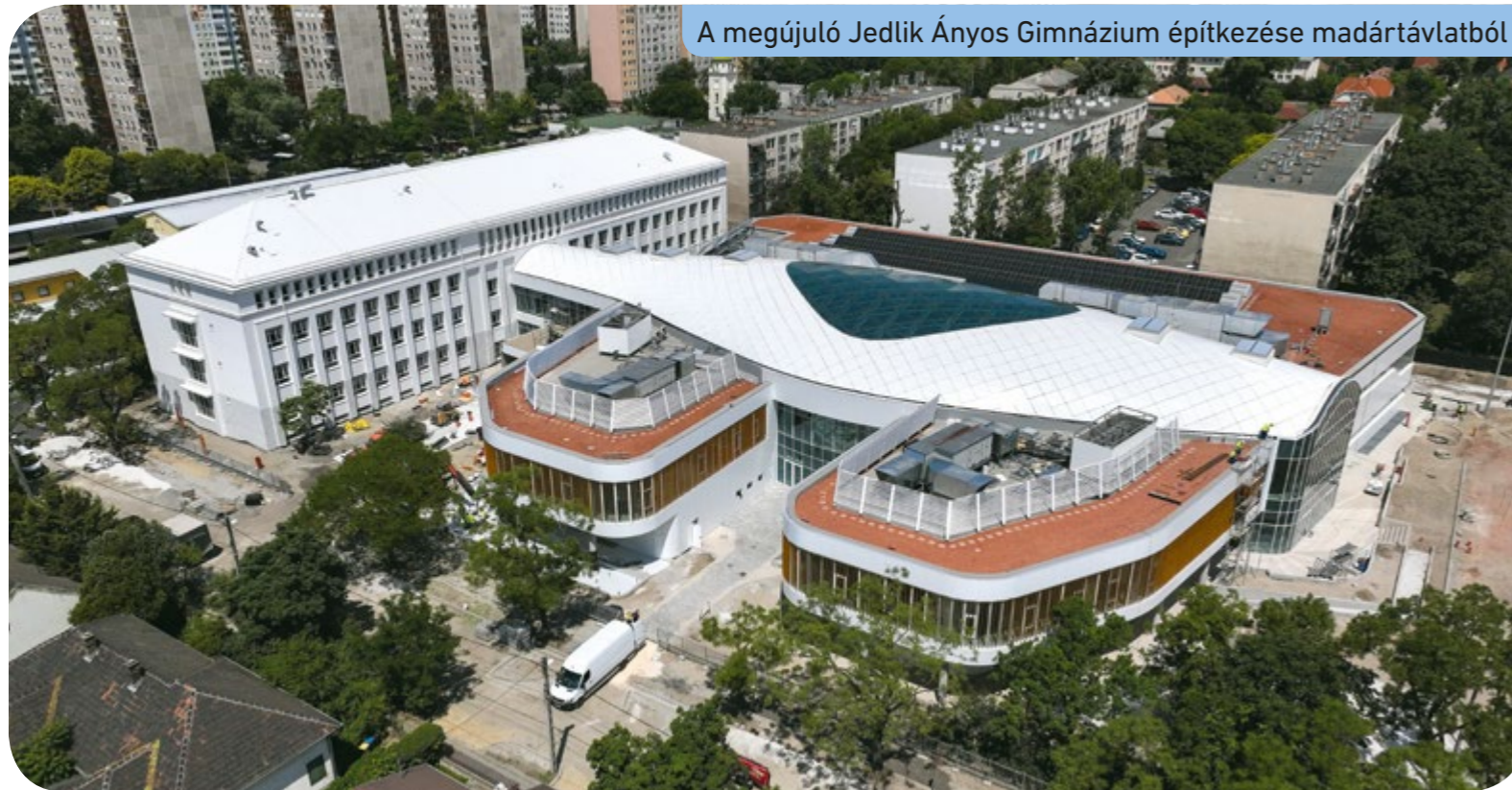
A megújuló Jedlik Ányos Gimnázium építkezése madártávlatból