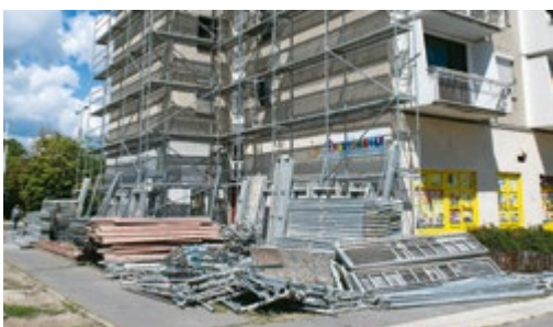
Csillagtelep: elkezdődött kilenc társasház energetikai megújítása