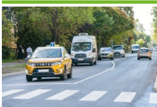
Befejeződött a Táncsics felújítása 6. OLDAL