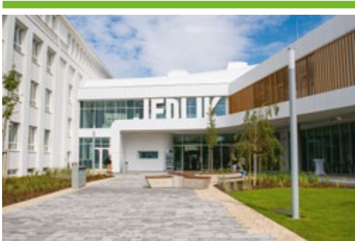
Átadták a megújult Jedliket 4. OLDAL