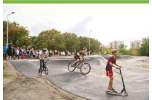
Új pumpapálya a Daru-dombon 8. OLDAL