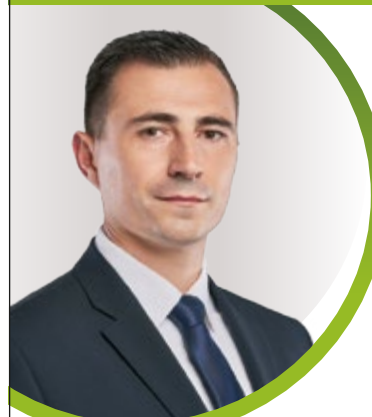
Borbély Lénárd Csepel polgármestere