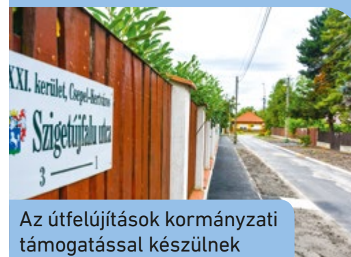
Az útfelújítások kormányzati támogatással készülnek

A közösségi fejlesztésekről szóló kormányhatározatok hátrányosan érintik a kerületet, ezért Borbély Lénárd