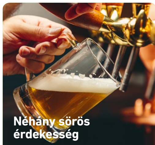
Néhány sörös érdekesség

A sör története egészen az ókorig nyúlik vissza . Akkoriban szüretlenül fogyasztották, így valószínűleg egy rendkívül zavaros, gyakran darabos ital lehetett.