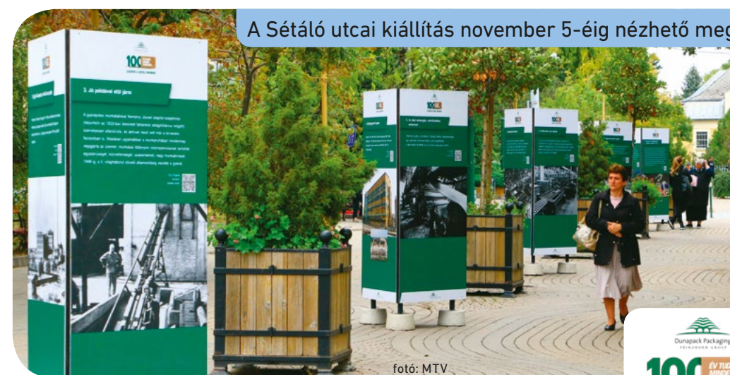
A Sétáló utcai kiállítás november 5-éig nézhető meg

tán. Elmondták, a csepeli üzemben jelenleg kétszáz munkatársuk dolgozik, túlnyomó többségük helyi lakos. Sokan több évtizeden át dolgoztak és dolgoznak az üzemben a törzsgárda tagjaiként. Családok egész nemzedékének adott megélhetést a gyár. A megtartó erőhöz hozzájárultak a színvonalas közösségi programok és sportolási lehetőségek. Evezősök, ökölvívók, úszók, tekézők szakosztályai működtek, 1956-ban korszerű sportpályát építettek részükre. 1985-ben készült el a sportuszoda, és volt szauna is. Ezeket a gyár dolgozói és a kerület lakói is használhatták. Most is támogatják a környezetvédelem és az oktatás területén tevékenykedőket. Főként iskolák keresik meg a vállalatot, őket adományaikkal segítik. A termelést illetően a Dunapack jelenleg főként újrahasznosított anyagokból készít hullámpapírt a kor színvonalának megfelelő modern és energiatakarékos gépeken, s ezzel az ország zöldgazdaságának egyik motorja is. Ahogyan a száz évvel ezelőtti kezdetekben is történt, a gyárra máig jellemző a legkorszerűbb technológia és a magas szintű szakmaiság ötvözése, amellyel nemcsak Magyarország, hanem a régió egyik vezető szereplőjévé vált. • cs. a.