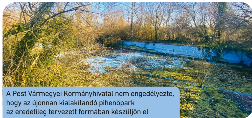
A Pest Vármegyei Kormányhivatal nem engedélyezte, hogy az újonnan kialakítandó pihenőpark az eredetileg tervezett formában készüljön el

Az eltávolításra kerülő szabadtéri rönkházikók nem fognak kárba veszni, azokat Csepel más közterületein és gyermekintézményeiben fogják újra felhasználni. Azon is dolgoznak, hogy az eredetileg a Kis-Duna ligetbe megálmodott, nyilvános mezítlás tanösvény egy másik helyszínen legyen kialakítva a kerületben. Az erdős rész peremén azonban megmaradhat a gyerekeknek szánt erdei szabadtéri tanterem és nyilvános, vandálbiztos vécével bővül a