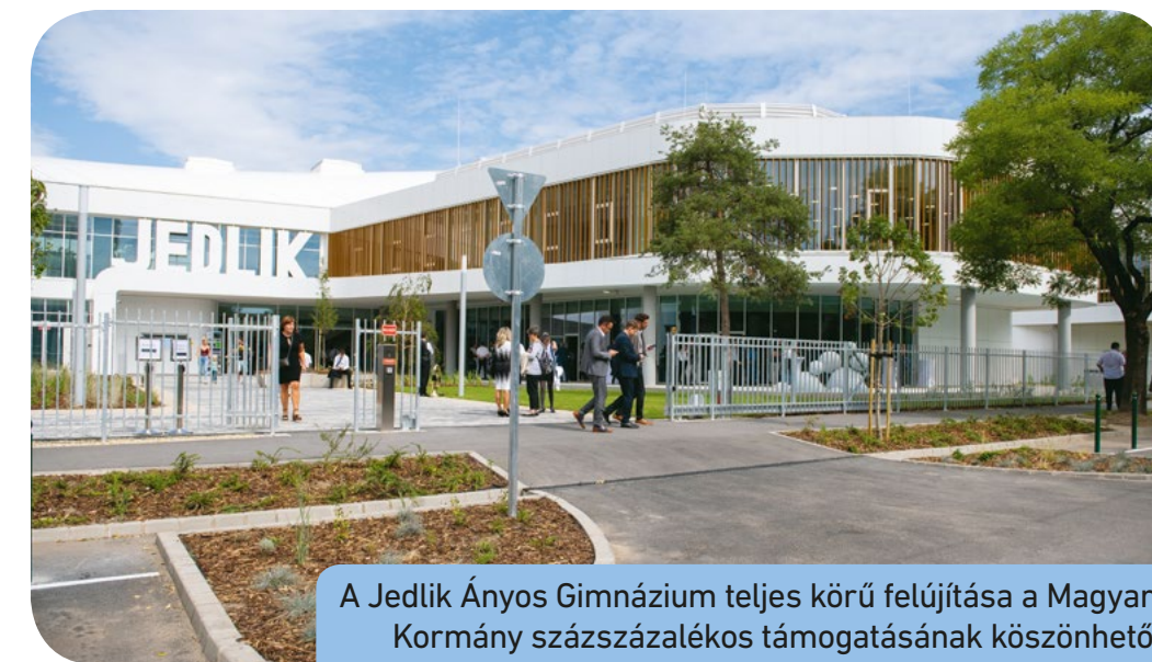
A Jedlik Ányos Gimnázium teljes körű felújítása a Magyar Kormány százszázalékos támogatásának köszönhető