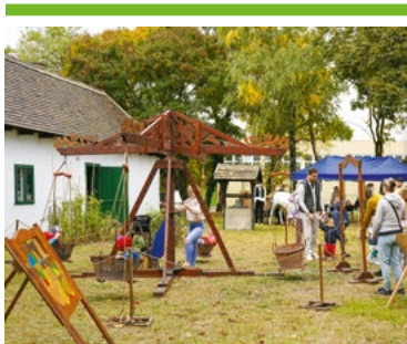
Szüreti mulatság a Királyerdei Művelődési Háznál