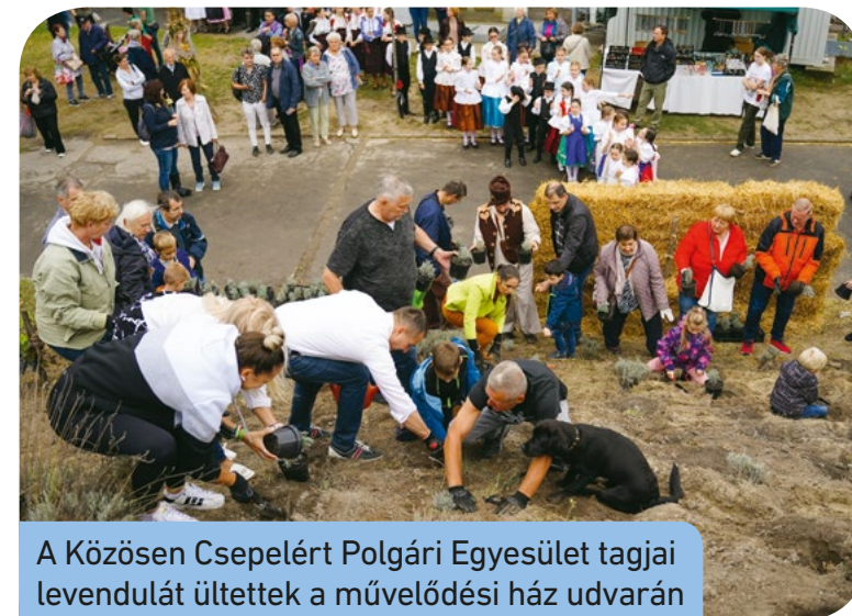
A Közösen Csepelért Polgári Egyesület tagjai levendulát ültettek a művelődési ház udvarán

A szüreti mulatságra kilátogatott Borbély Lénárd polgármester is, aki a Közösen Csepelért Polgári Egyesület tagjaival együtt a művelődési ház udvarának bejáratánál levendulapalántákat ültetett el. A közös virágültetésbe néhány szülő és gyerek is bekapcsolódott. • Lass Gábor