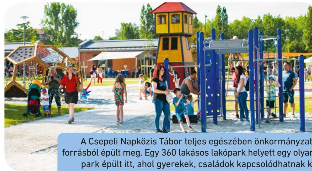
A Csepeli Napközis Tábor teljes egészében önkormányzati forrásból épült meg. Egy 360 lakásos lakópark helyett egy olyan park épült itt, ahol gyerekek, családok kapcsolódhatnak ki

ője, ennek keretében kilenc panelépület esik át energetikai felújításra, emellett 100 milliós kerettel elindult a Csepeli Panelprogram, amelynek keretében társasházak pályázhatnak energetikai korszerűsítésre. „Célunk, hogy Csepel tisztább, zöldebb, energiahatékonyabb legyen, erről szólnak a társasházfelújítások, de erről szól például a Csepeli Zöld Sziget Programunk is, ennek keretében már jóval több mint tízezer fát ültettünk el kerületszerte – az egyik legtöbbet a fővárosi kerületek közül.”