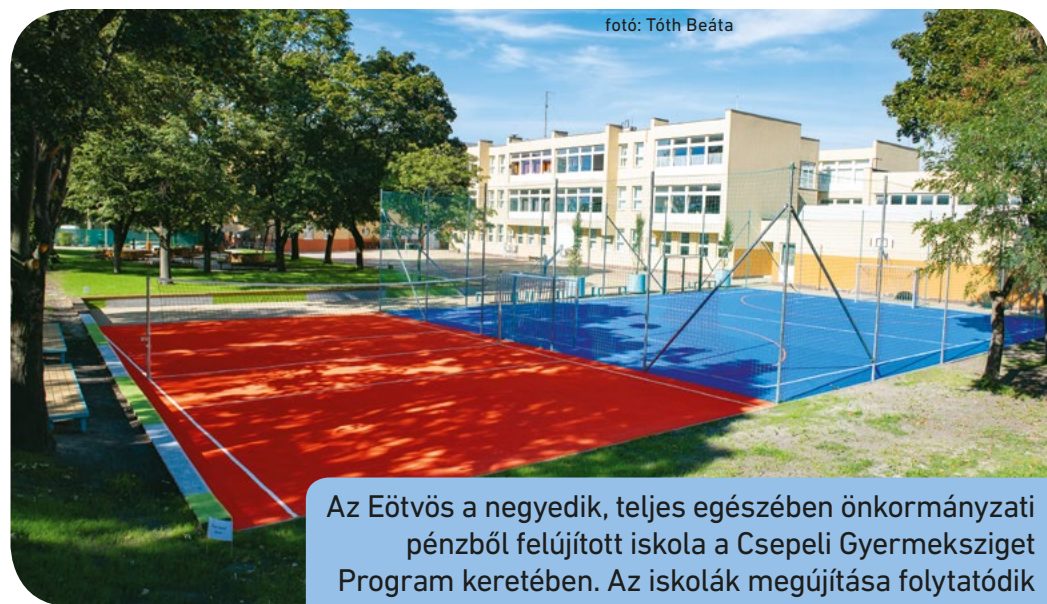
Az Eötvös a negyedik, teljes egészében önkormányzati pénzből felújított iskola a Csepeli Gyermeksziget Program keretében. Az iskolák megújítása folytatódik

Közben nagy eredmény, hogy idén folytatódott a Csillagtelep városrehabilitáci-