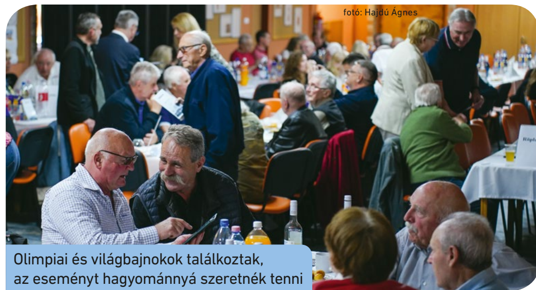
Olimpiai és világbajnokok találkoztak, az eseményt hagyománnyá szeretnék tenni

Első alkalommal rendezték meg a Csepel SC korábbi sportolóinak találkozóját a Királyerdei Művelődési Házban szeptember 13-án, amelyen csaknem százhatvanan vettek részt. Olimpiai és világbajnokok jelentek meg az eseményen, de természetesen bárki ott lehetett, aki valaha a Csepel SC-ben versenyzett. A tervek szerint ugyanúgy hagyománnyá kívánják tenni a találkozót, mint a Csepel Művek egykori dolgozóinak évente megrendezett összejövetelét.