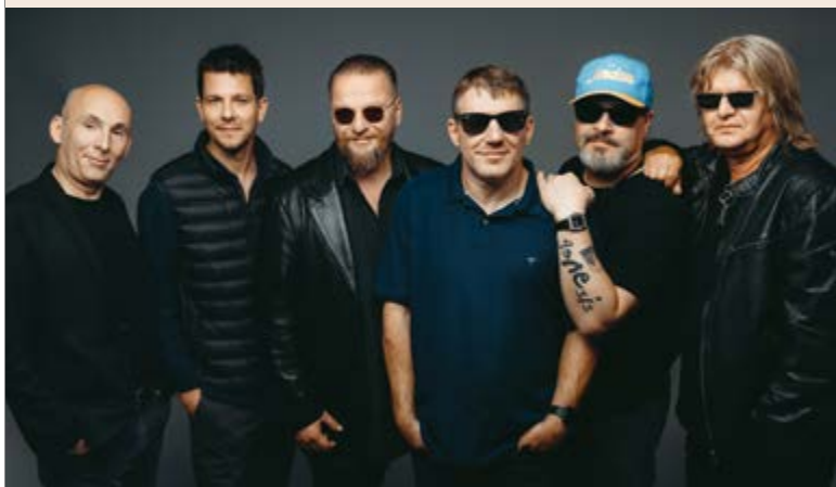
Borbély Lénárd Csepel polgármestere

A koncertre – a helyek korlátozott száma miatt – regisztráció szükséges, amit az info@csepelivaroskep.hu e-mail címen tehetnek meg 2023. december 13-a és 23-a között.