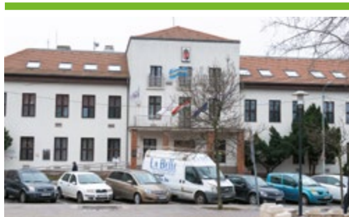
Nyilvánosak az önkormányzati képviselők vagyonyilatkozatai