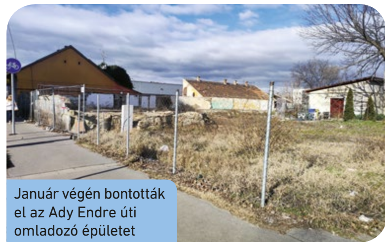
Január végén bontották el az Ady Endre úti omladozó épületet