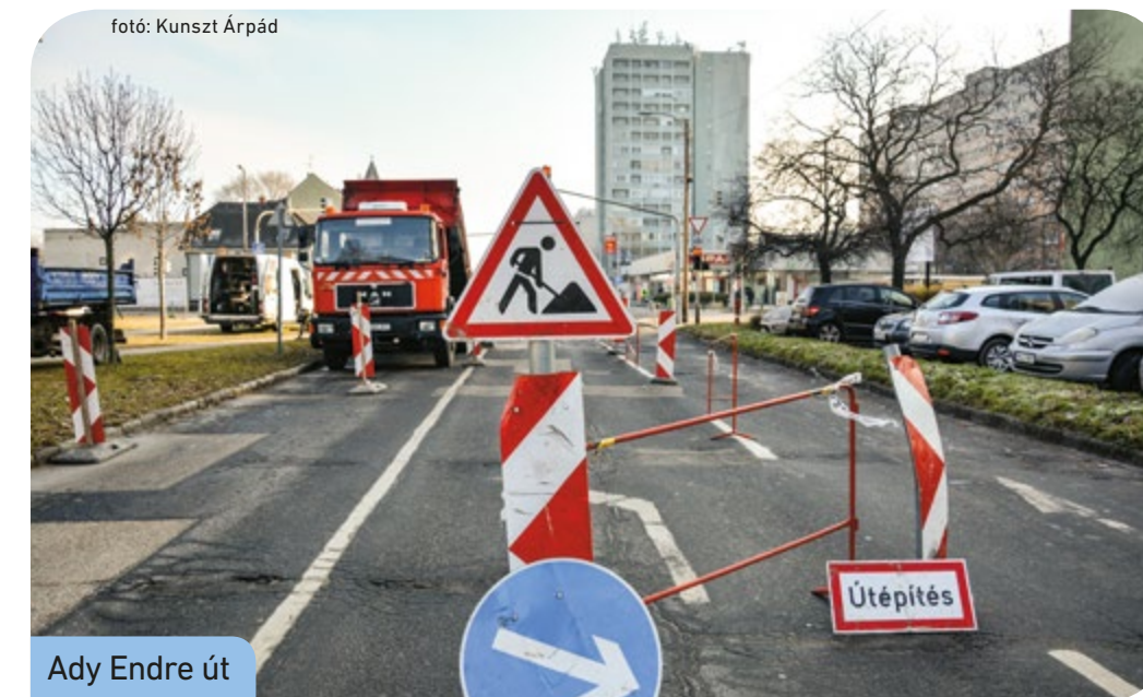
Ady Endre út

Kolozsvári utcában a Széchenyi utca és József Attila utca közötti szakaszán.