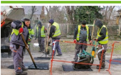
Kátyúzás: javítják a kerületi fenntartású utakat