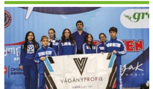
Halker-KirályTeam: diadal az Athens Challenge-n