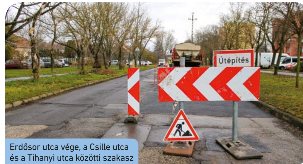
Erdősor utca vége, a Csille utca és a Tihanyi utca közötti szakasz

A Csepeli Városgazda Zrt. munkatársai január 24-e óta folyamatosan végzik a kátyúzási munkálatokat a csepeli fenntartású utakon a kerület közterületein.