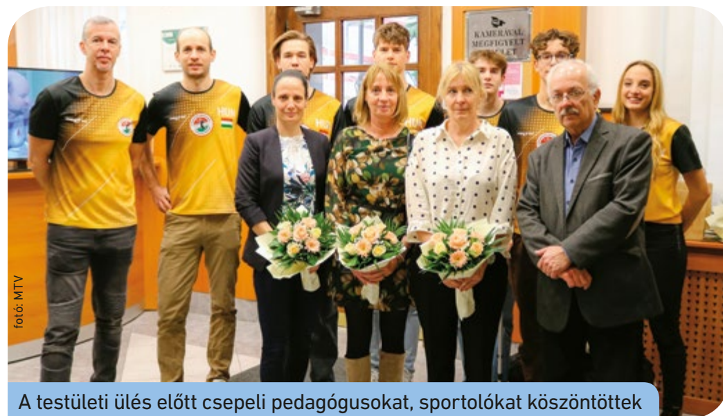
A testületi ülés előtt csepeli pedagógusokat, sportolókat köszöntöttek