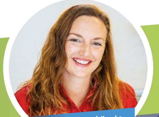
A program nagykövete: