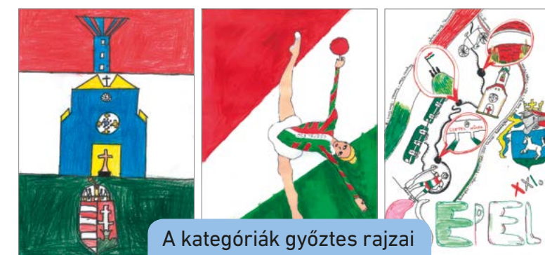
A kategóriák győztes rajzai

A döntősöket március 19-én köszöntötték a polgármesteri hivatalban. A gyerekek rajzai plakátokon már az egész kerületben láthatók. • Csarnai