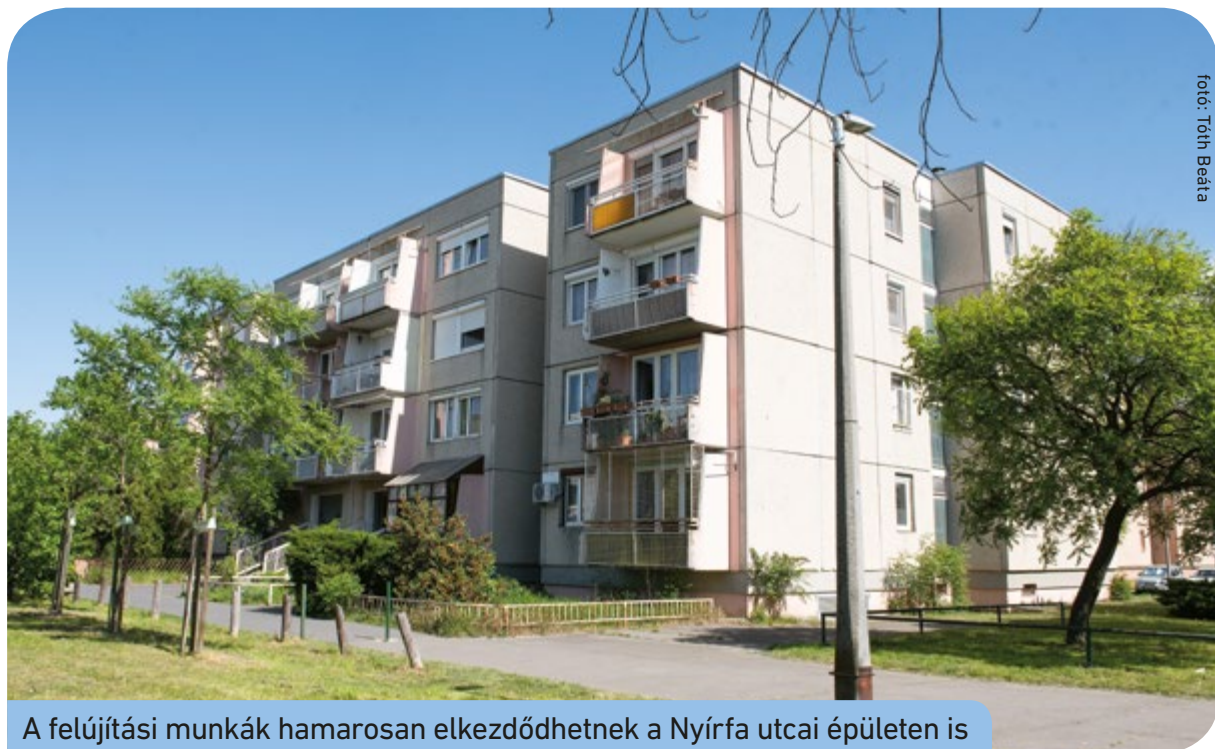
A felújítási munkák hamarosan elkezdődhetnek a Nyírfa utcai épületen is