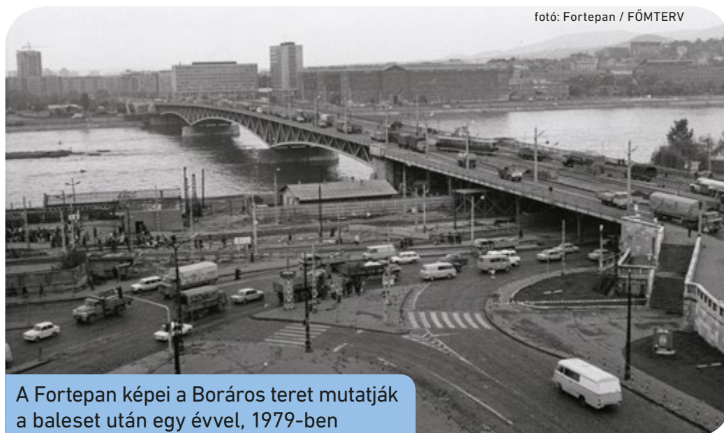
a Boráros teret mutatják a baleset után egy évvel, 1979-ben