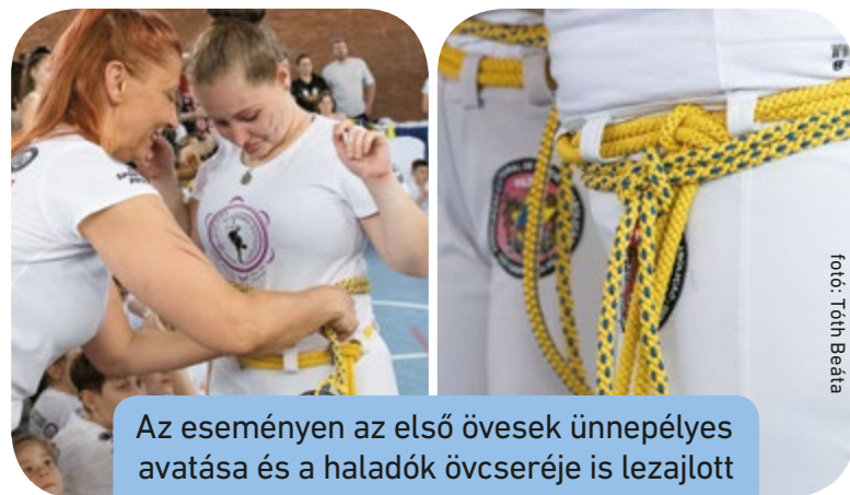
Az eseményen az első övesek ünnepélyes avatása és a haladók övcseréje is lezajlott