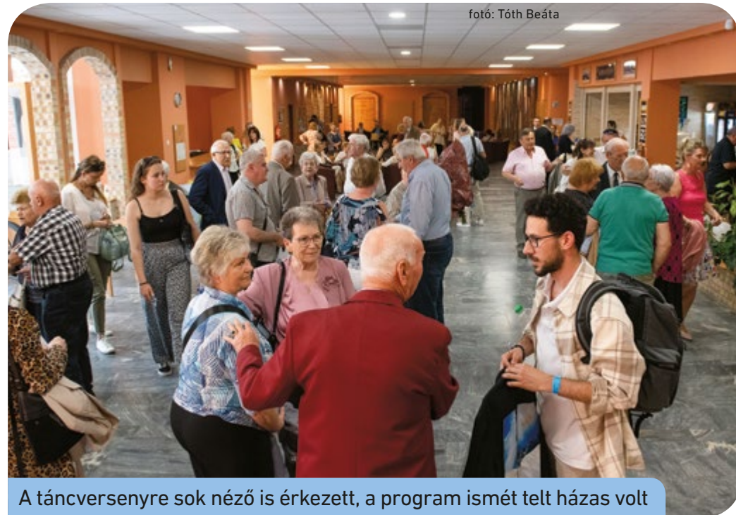
A táncversenyre sok néző is érkezett, a program ismét telt házas volt