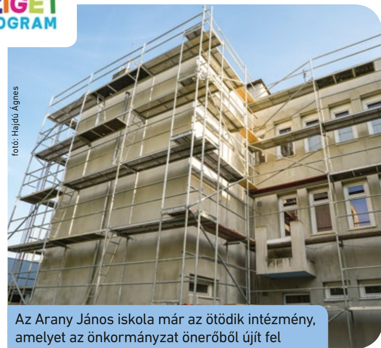
Az Arany János iskola már az ötödik intézmény, amelyet az önkormányzat önerőből újít fel